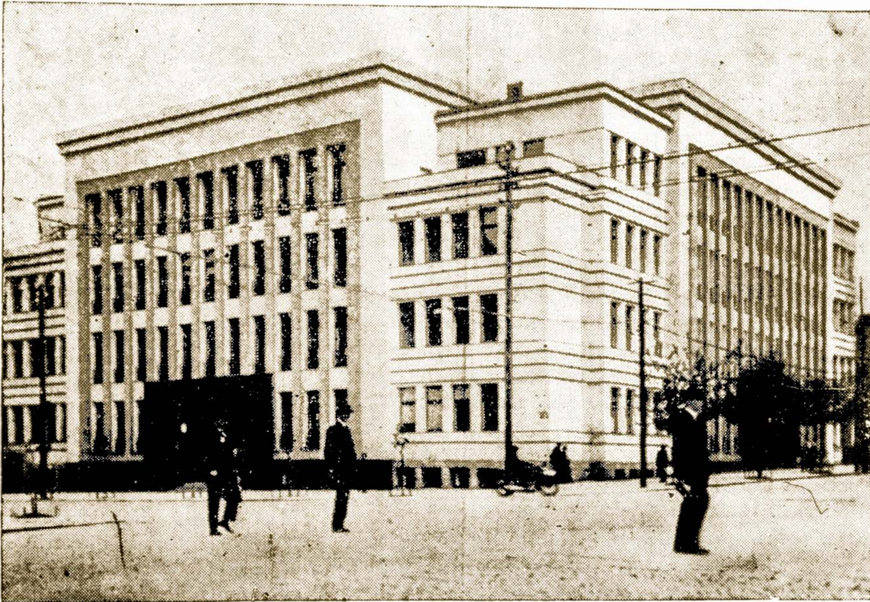
Vienas Moderniškų Pastatų, Kurį Dabar Laiko Užėmęs Bolševikų Partijos Centras.

Didžiųjų kanuolių dundėjimą, prie gerų oro aplinkybių, galima girdėti 100 mylių atstume. South Dakotos gubernatorių gauna $3,000 į metus, o New Yorko valstijos — $25,000.