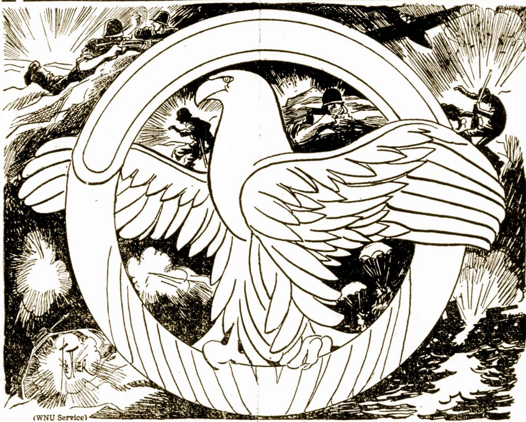
Ješko Hitlerio Lavono

Sovietų kareiviai kasinėdami tarpe griuvėsiu, ješko Hitlerio lavono. Maskvos spauda pareiškė abejonių, kad Hitleris ištikro nusizūdė, kaip tą paskelbė vokiečių radio.