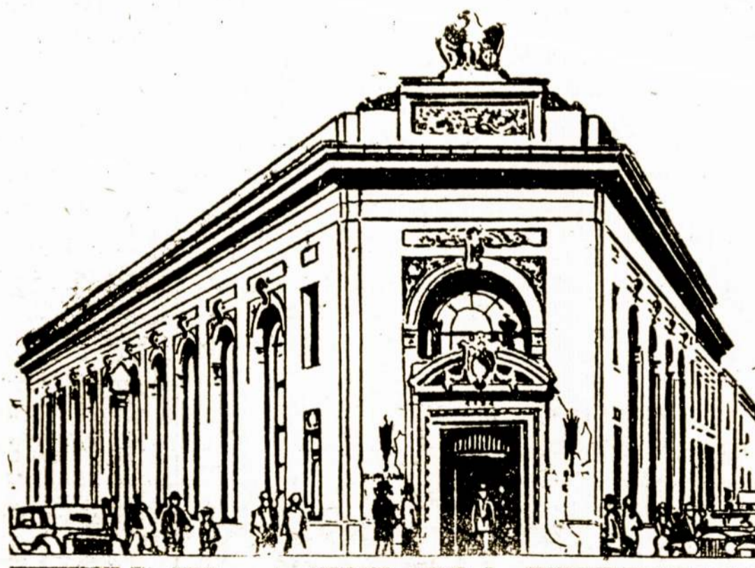
Narys Federal Savings and Loan Insurance Corporation, Washington, D. C.

Greta apdraudós sąskaitų tamstų investimentas yra apsaugotas taipgi mūsų dideliais rezervais.