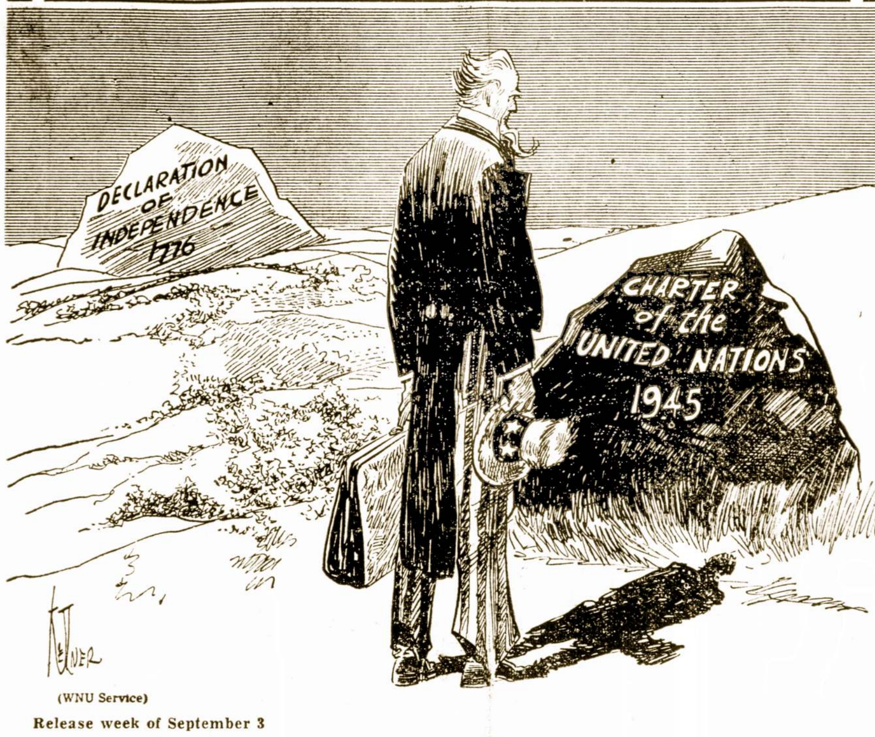
(WNU Service) Release week of September 3