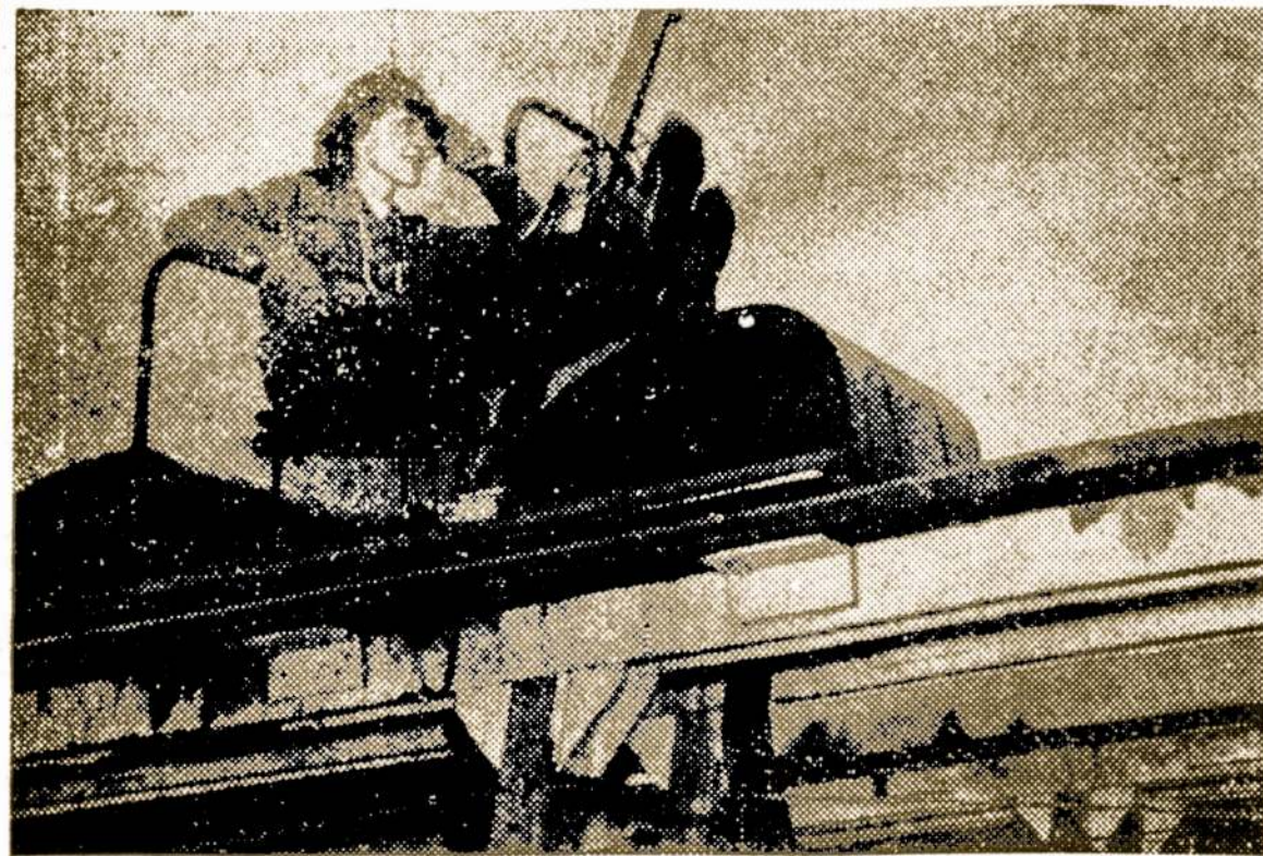
TAKING THE CLIMB OUT OF SKIING . . . The fly in the ointment when it comes to the real enjoyment of skiing is the long, weary trudge up the ski slope, before one can make that exhilarating dash down. On Cranmore mountain, near North Conway, N. H., this trudge is eliminated by the ski-mobile, a gadget that gives you a ride up. The pretty skier is one of the first contingent of enthusiasts to visit North Conway with the resumption of the "snow train" from Boston.

Vienas asmuo gavo nuo savo sesers laišką iš Latvijos, kuriame sakoma: "Liepojaus, kaip ir kiti Latvijos miestai yra smarkiai sunaikinti. Vienoj didesnių Liepojaus gatvių tik keturi namai užsiliko, bet ir jų langai lentomis užkalti, nes trūksta stiklo."