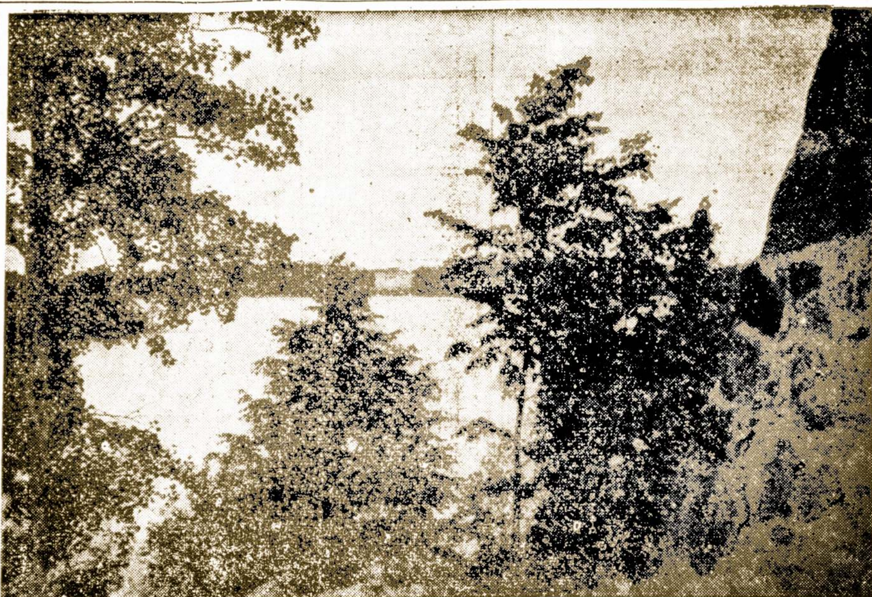
Trakų Ežero Vaizdas. Dešinėje Matome Liekanas Senoviškos Pilies.

Man rodos, jog tokie eksperimentai būtų labai pavojingi. Amerika taip nusilpnėję, jog užsidarytų ne vien Čikagos stockyardai, bet ir visa didžioji industrija. Indijos gyventojai, didžiūmoje ingi nevaržoja mėsos, bet jie taip pat, kad savo jėgomis negali pasijudinti.