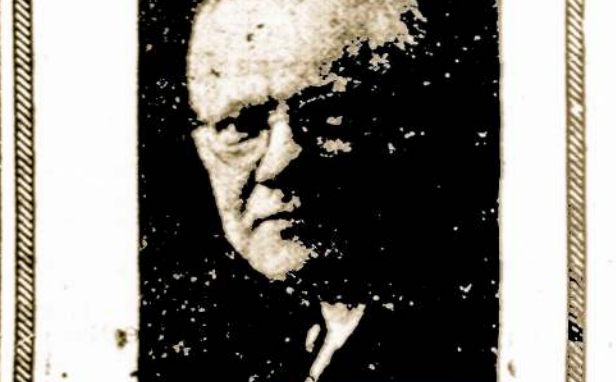
W. J. STANKUNAS FOTOGRAFAS

Fotografavimo Studija Visų Rusių Nuotraukos