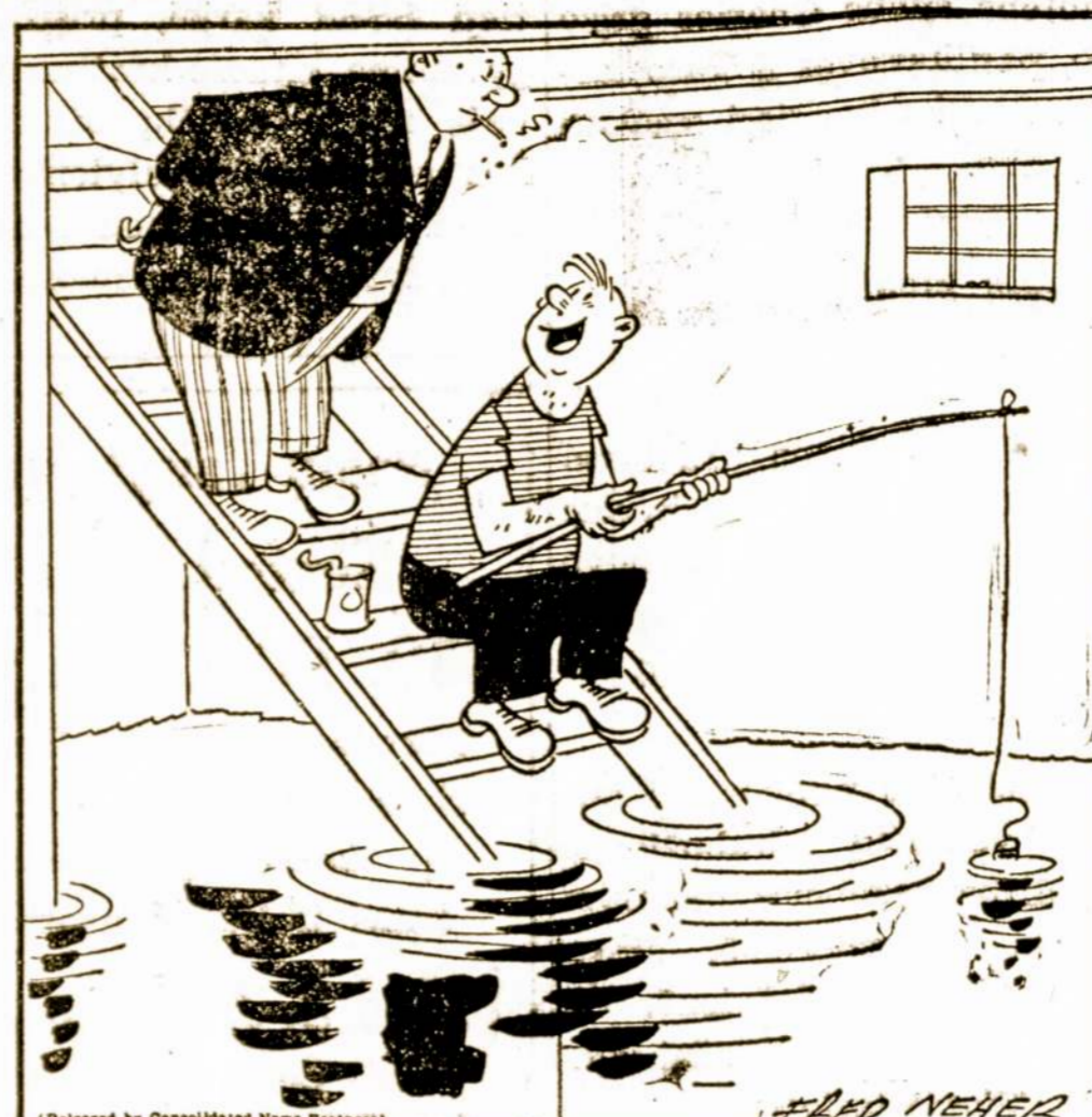
"I have so much water in my basement I got permission from the State to stock it with Bass."