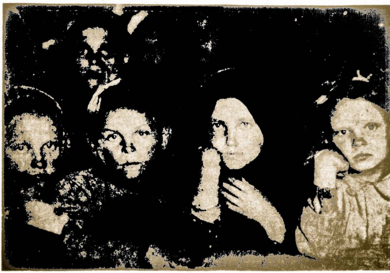
Grupė Lietuvi Našlaičių Vienoje Tremtinių Stovykloje Vokietijoje