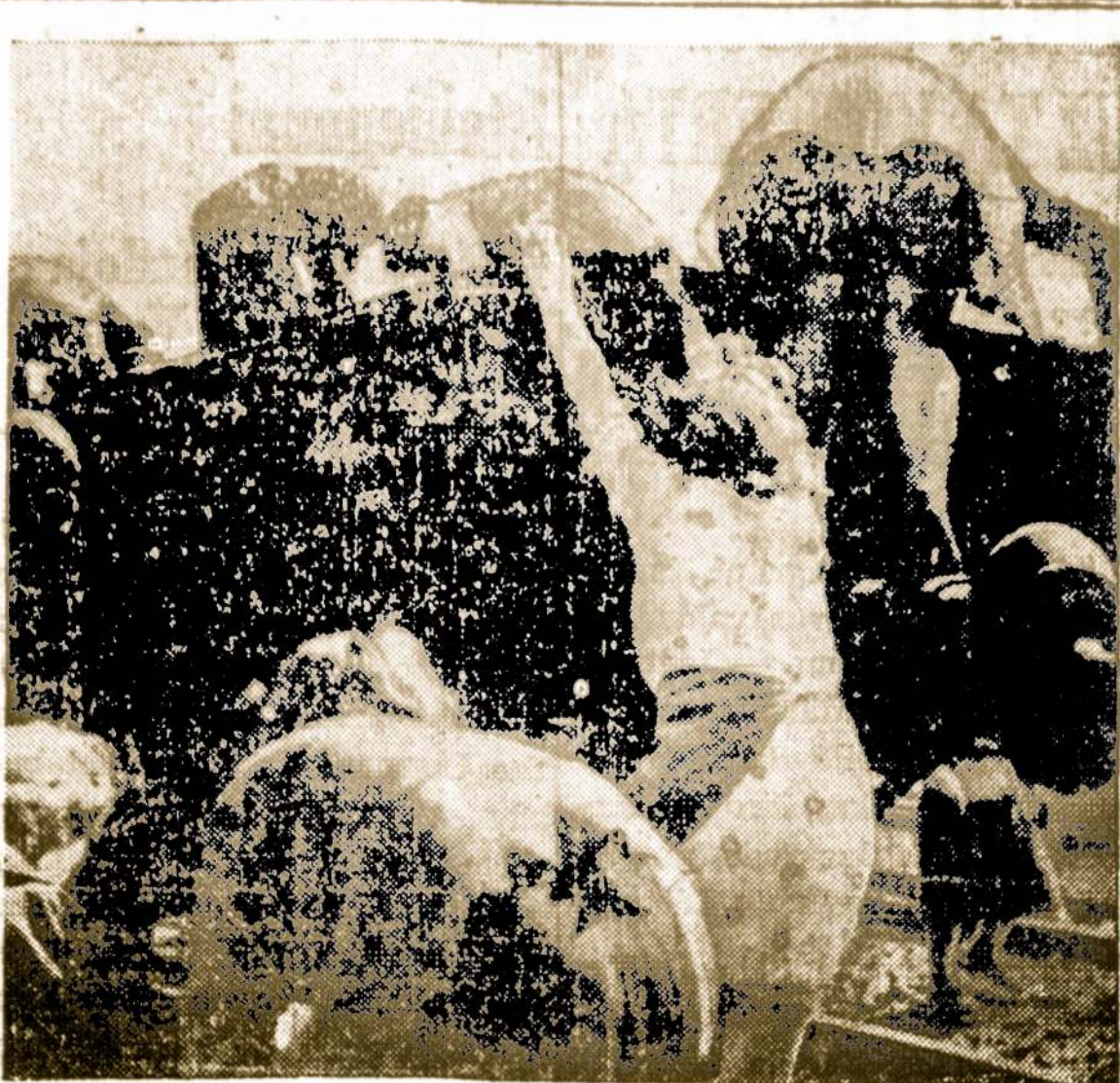
Vokietijos Žmonės Rankioja Iš Ištuštintų Vagonų Anglies Gabalėlius Naminiam Kurui.

Waterburio L. Tarybos sekančis susirinkimas įvyks gegužės 25 d., (vietoje 11 d.) 3 val. po pietų, L. Nep. Politinio Kliubo