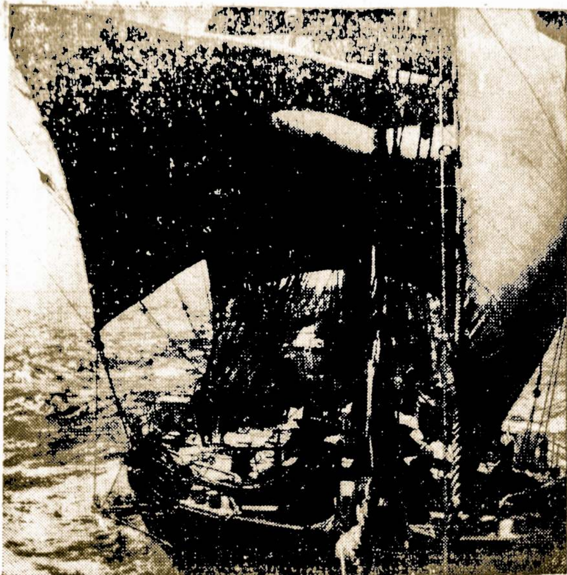
Vokiečių Laivas Dabar Jungtinių Valstijų Tarnyboj. Jis Naudojamas Lavinti Jūrininkus prie Coast Guard. Paveikslas Nuimtas arti New London, Conn.

Holandų East Indies apima Alaskos sostinė yra Juneau.