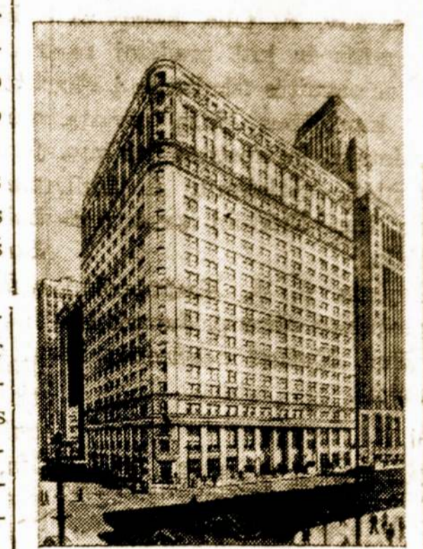
The New Chicago Title and Trust Company Building