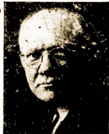
W. J. STANKUNAS FOTOGRAFAS

Fotografavimo Studija Visų Rušių Nuotraukos