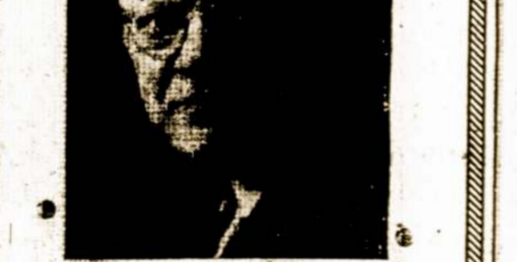
W. J. STANKUNAS FOTOGRAFAS

Fotografavimo Studija Visų Rušių Nuotraukos