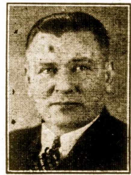
JOHN PAKEL & CO.

SVEIKINAME SAVO DRAUGUS IR KOSTUMERIUS PAVASARIO ŠVENTESE - VELYKOSE.