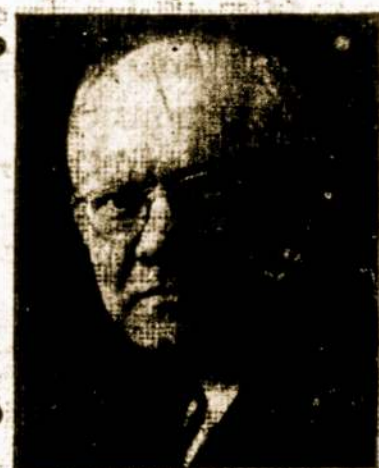
W. J. STANKUNAS FOTOGRAFAS

Fotografavimo Studija Visų Rušių Nuotraukos