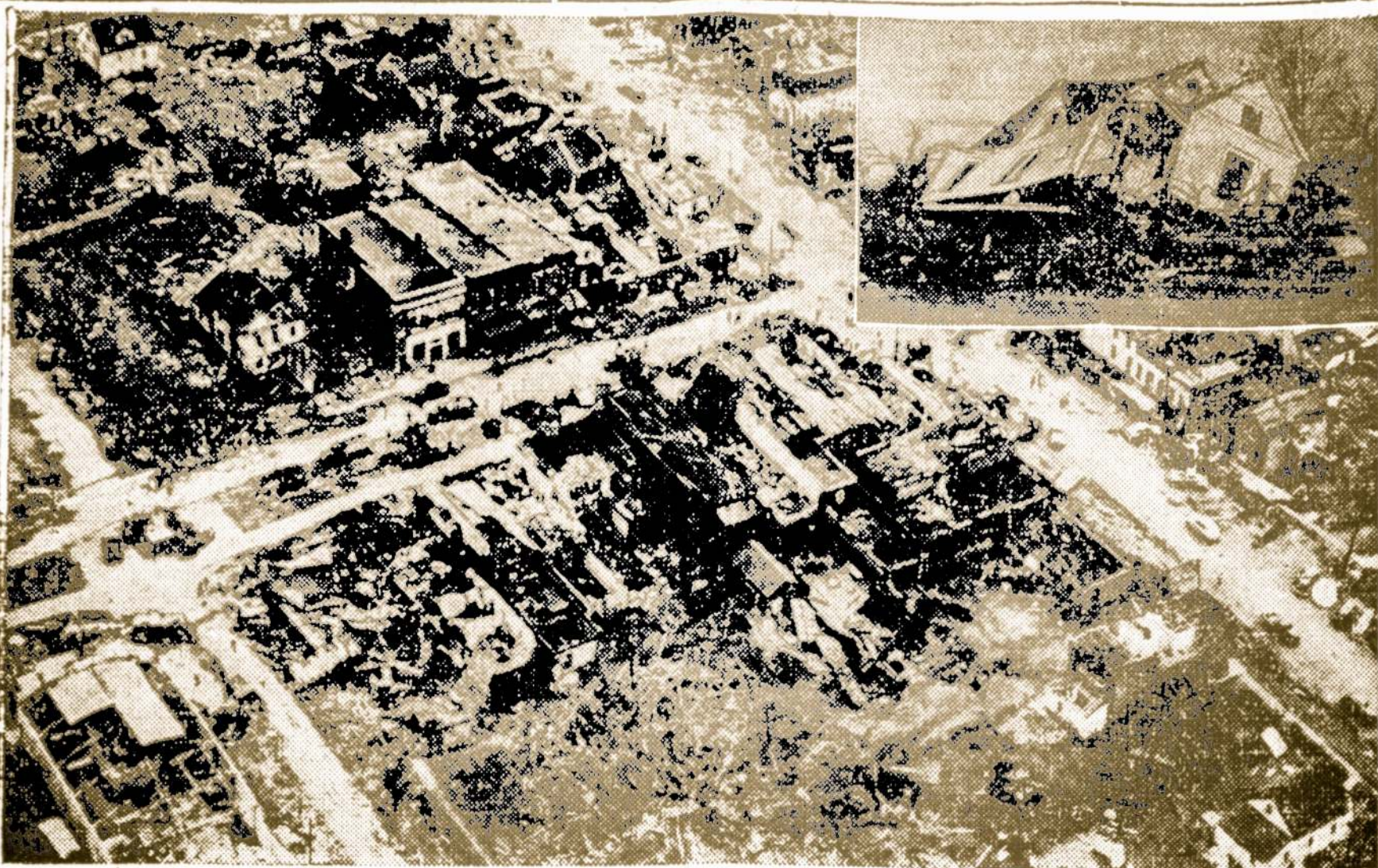
SHATTERED BUNKER HILL... The word "tornado" invariably calls to mind two accompanying descriptive terms, "death and destruction," and in the case of the twister that howled through western Illinois those adjectives were as appropriate as ever. It cut a furious swath through an area 50 miles wide and 100 miles long, leaving behind a death toll of 31 and a trail of shattered residences. Hardest hit community was Bunker Hill, almost completely destroyed by the force of the tornado. Inset shows a closeup of one of many houses that were shattered like carboard toys.

Didieji maisto gamintojai Amerikoje jau kalba, jog šią vasarą maisto kainos turės nukristi, nes derlius numatomas labai geras. Nuo gegužio 1 dienos pradėjo veikti ir taksų sužadinimas. Tas viskas gal pagerins žmonių nuotalką ir su mažins streikų epidemiją.