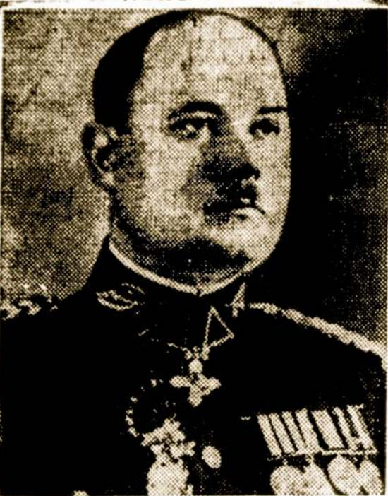
GEN. J. ČERNIUS

New Yorko ir New Jersey Draugijų Atstovų Konferencija įvyks sekmadienį, birželio 6 d., American Common Salėje, 40 East 40th St., kamps Park Ave., prie Grand Central stoties, New York, N. Y. Konferencija prasidės 2 val. pp. ir baigsis 6 val. vakare. Svečiai irgi kviečiami.