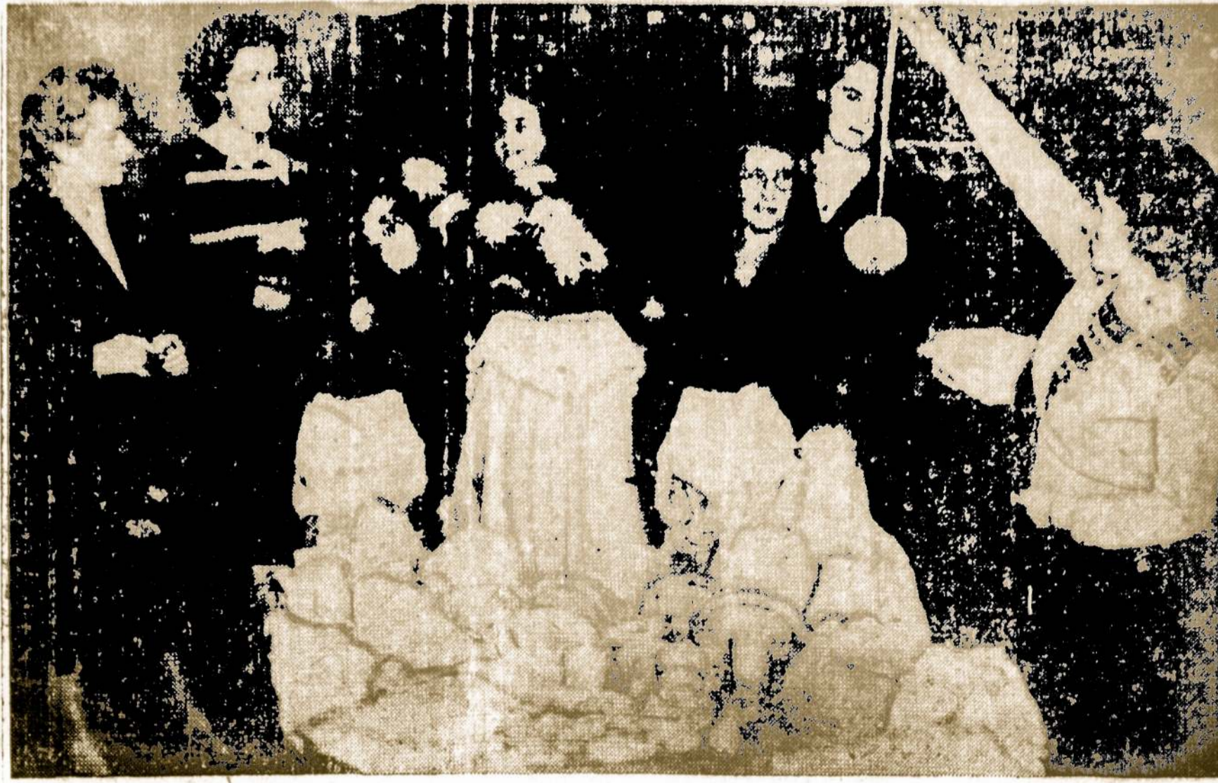
LAYETTE FOR A ROYAL BABY... The baby scheduled to be born to Princess Elizabeth in mid-November will be born, just as were you and I, without a shirt to its royal back. But it won't be long in that undignified state, thanks to these members of the Nursery Nurses Association of England, who made this layette for the new princess or princeling. It includes all that a well-dressed baby should wear, plus a set of feed-utensils, rattles and toys. When the baby is born, England will stage its gayest celebration since the end of the war.