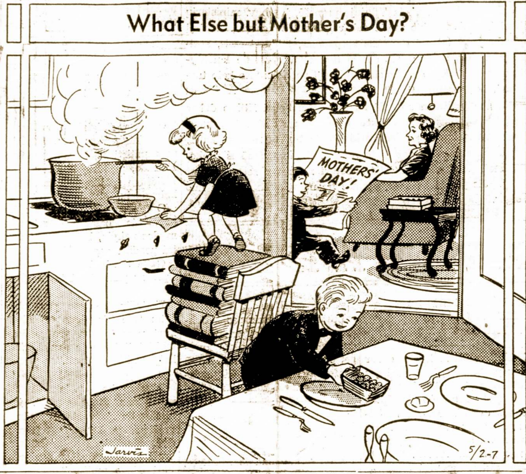
What Else but Mother's Day?

J. V. paštas turėjęs 500 mil- lionų dolerių deficito. Tuos trū- kumus dabar manoma išlygtinti padidinant mokesnį už laikraš- čių ir kitokių spausdinto žo- džių siuntinėjimą. Jeigu taip įvyktų, tai daugelis laikraščių nebeįstengs suvesti galų su ga- lais.