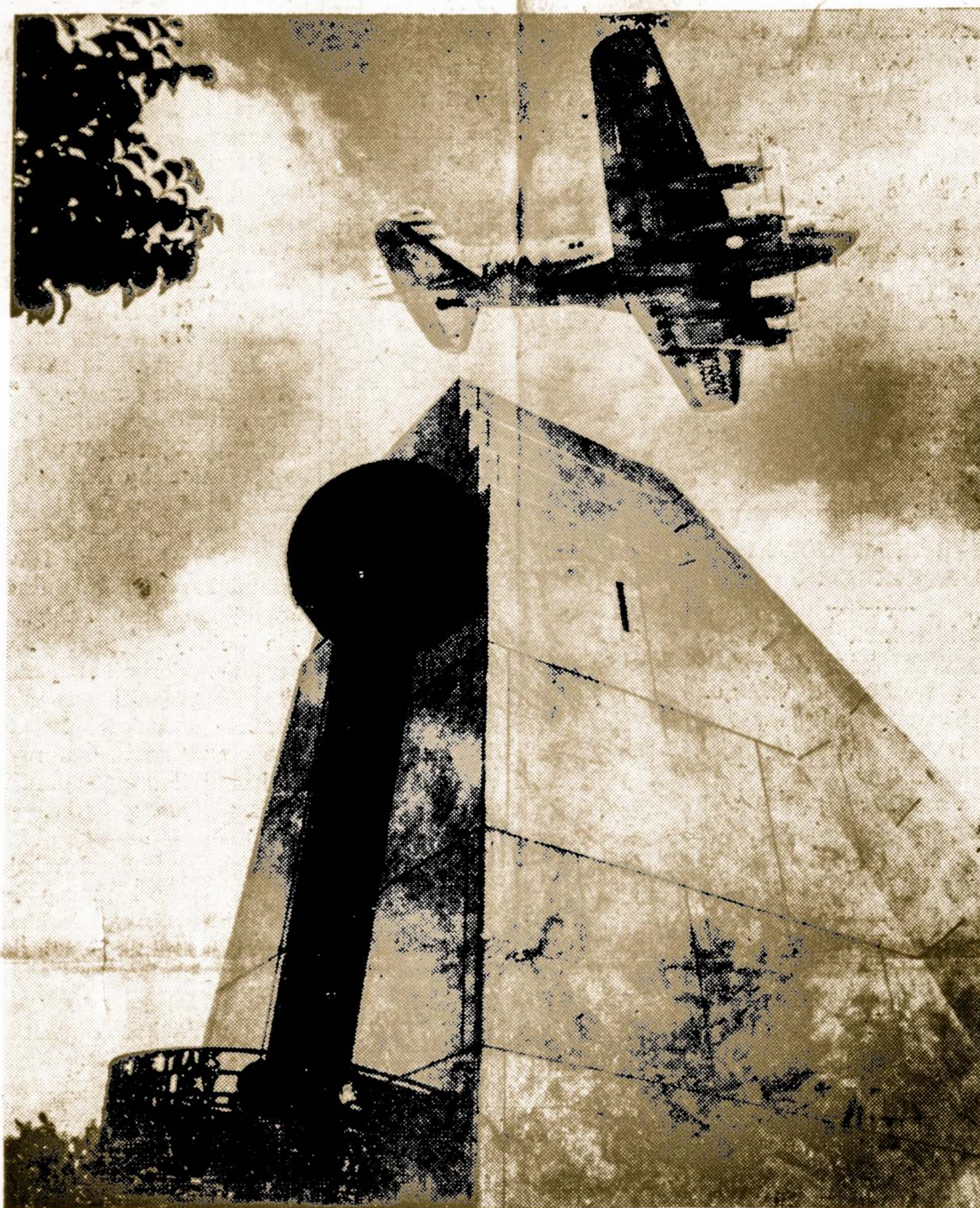
Šį Sekmadienį Prie Sio Dariaus-Girėno Paminklo Chicagoje Įvyksta Didelės Iškilmės. (Daugiau žinių paskutiniame puslapy).