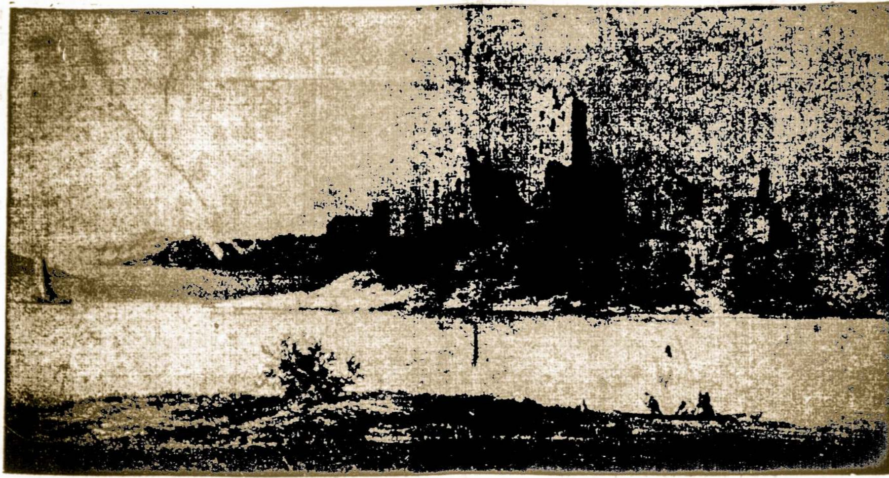
Trakų Pilies Griuvėsiai, Viduryje Ežero. Platesnis Trakų Aprašymas Tilpsta 4-tam Puslapy.

Bet ką reikėtų tas aukso pabranginimas Amerikai? Nieko daugiau tik dolerio nupigūnimas. Popierinio dolerio vertė nukristų 8 nuoš., o kainos tiek iškilų. Todėl panašius pasiūlymus reiktų mesti į užpečių.