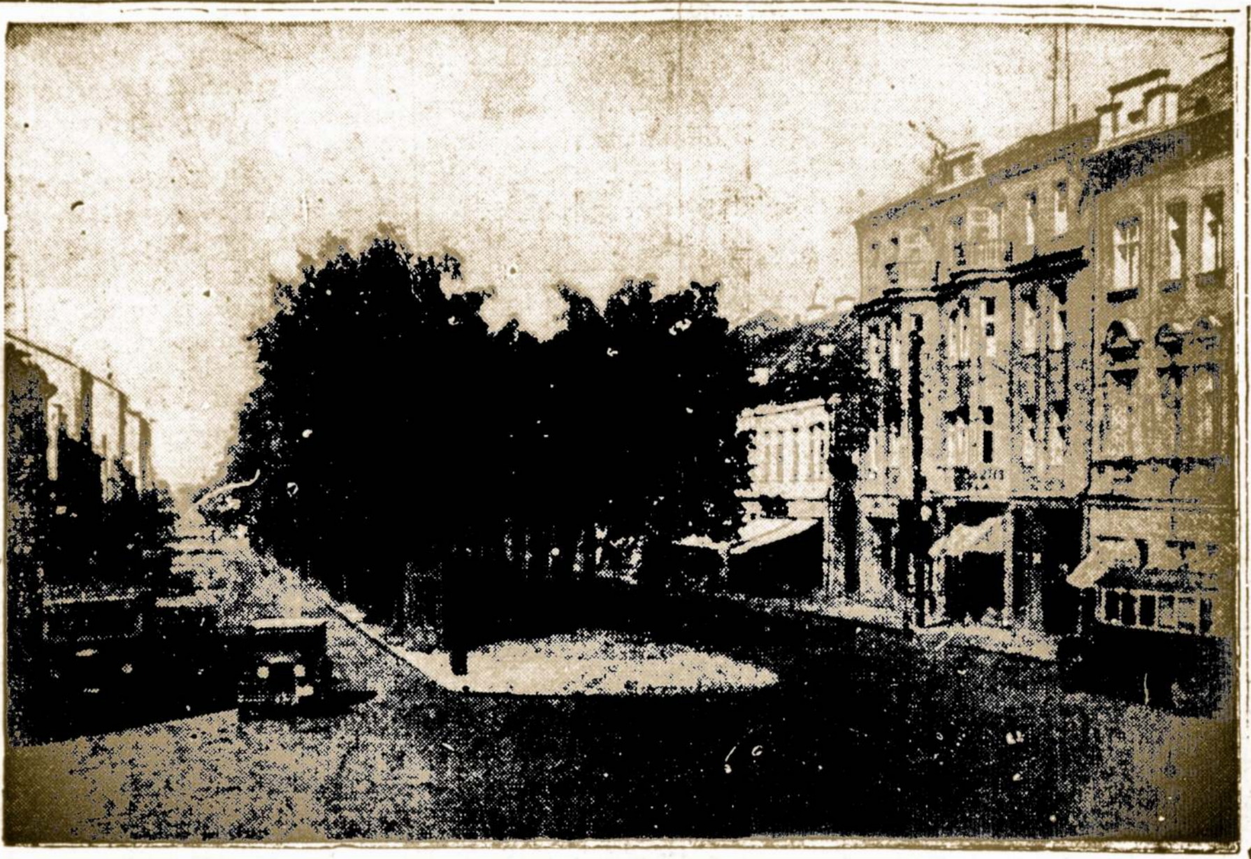
Laisvės Alėjos Vaizdas Kaune, Nepriklausomos Lietuvos metu.

O tuom tarpu, jei bolševikams seksis galutinai sudoroti rytinę ir centro Europą, juodos dienos atels ir vakarams.