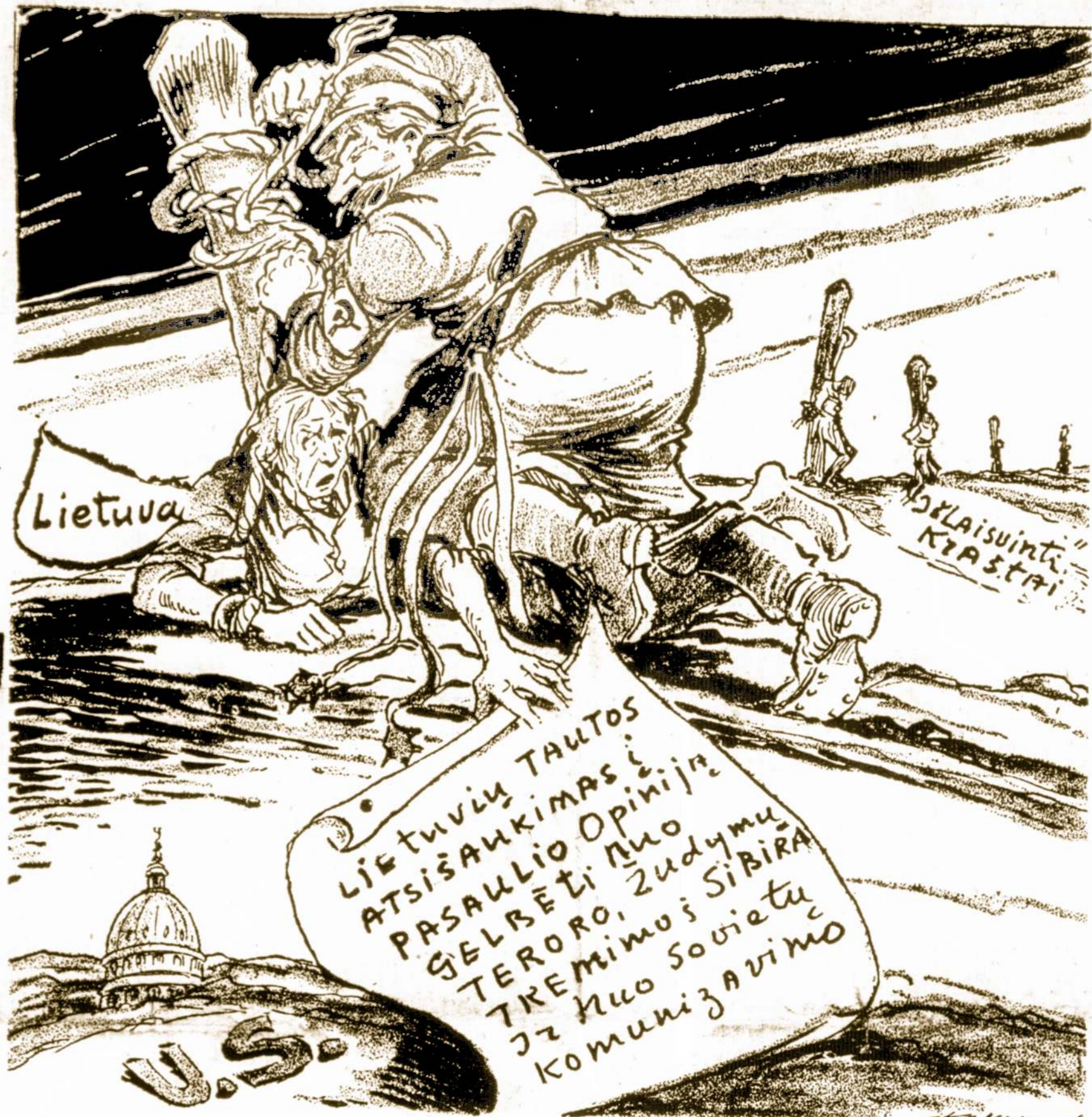
Tikslas Mūsų Konferencijų, Rytų — Chicagoj: Lapkričio 4-5 New Yorke.

Pabaigoje sekančios savaitės Philadelphia, Pa. įvyksta Bendrojo Amerikos Lietuvių Šalpos Fondo seimas. Jis tęsis porą dienų ir išrinks naujus direktorius bei valdybą. Reikalinga kad ir į šį seimą atvyktų kiek galima daugiau delegatų. Šal- pimo akcija šiuo metu yra reikalinga sustiprinimo ir dides- nės paramos.