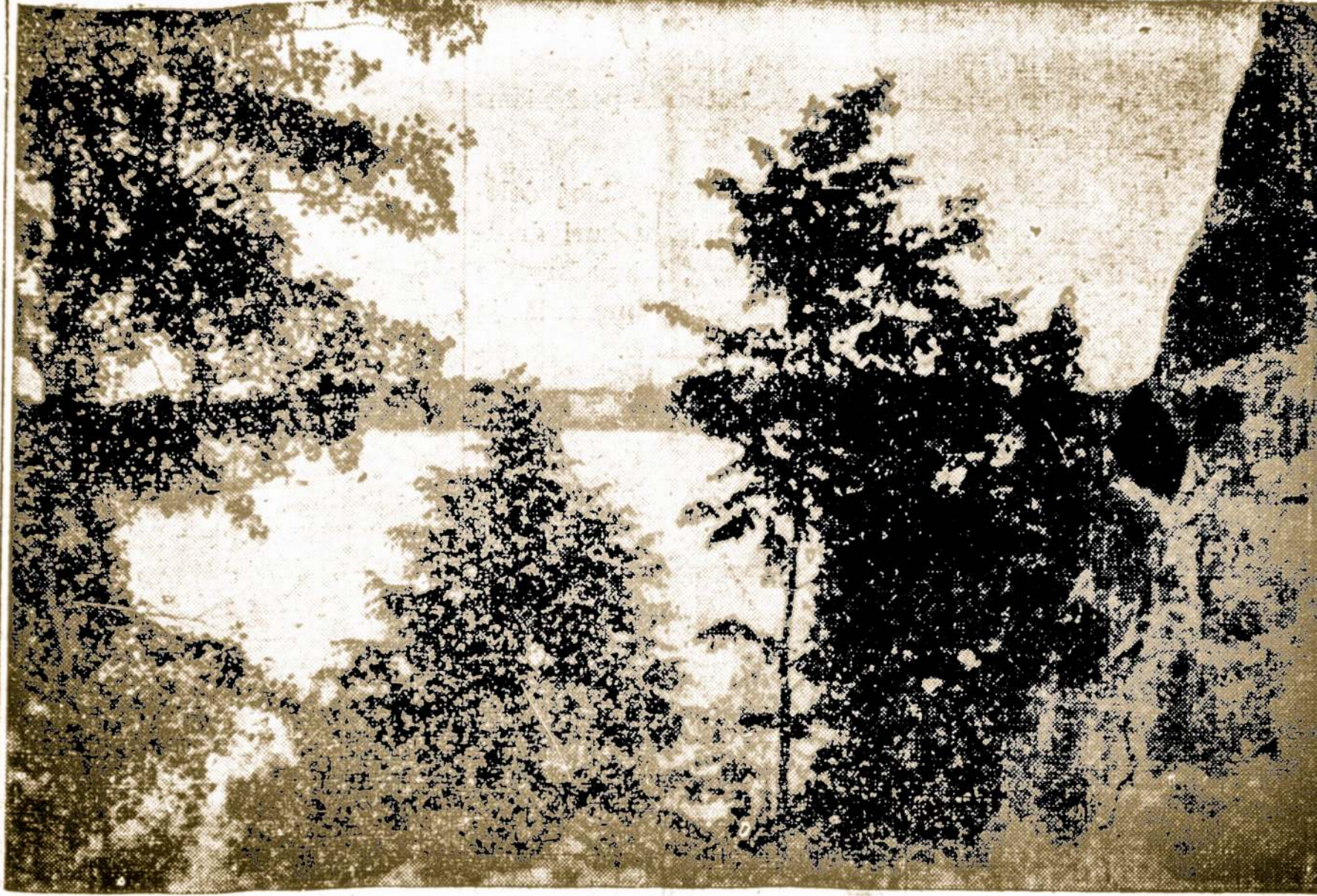
Gražus Lietuvos Kampelio Vaizdas Ežerėnų Apskrityje