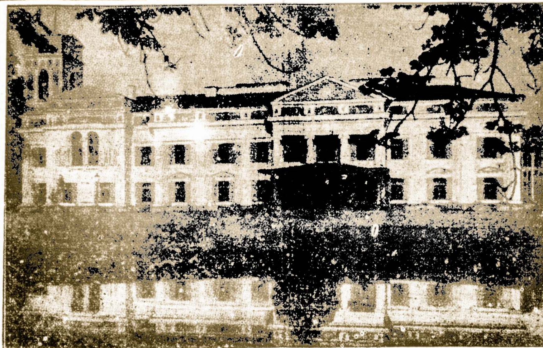
Senoviškų Rūmų Vaizdas Lietuvos Krašte.

Finansavimui tų ekstra devynių mėnesių veiklos paskirta $55,000,000. Veik pusė tos sumos — 25 mil. dolerių pasisąžinėjo įmokėti Jungtinės Valstijos. Taigi, užsilikusieji Vokietijoje ir Austrijoje tremtiniai bus globojami iki balandžio mėn. 1951 metų.