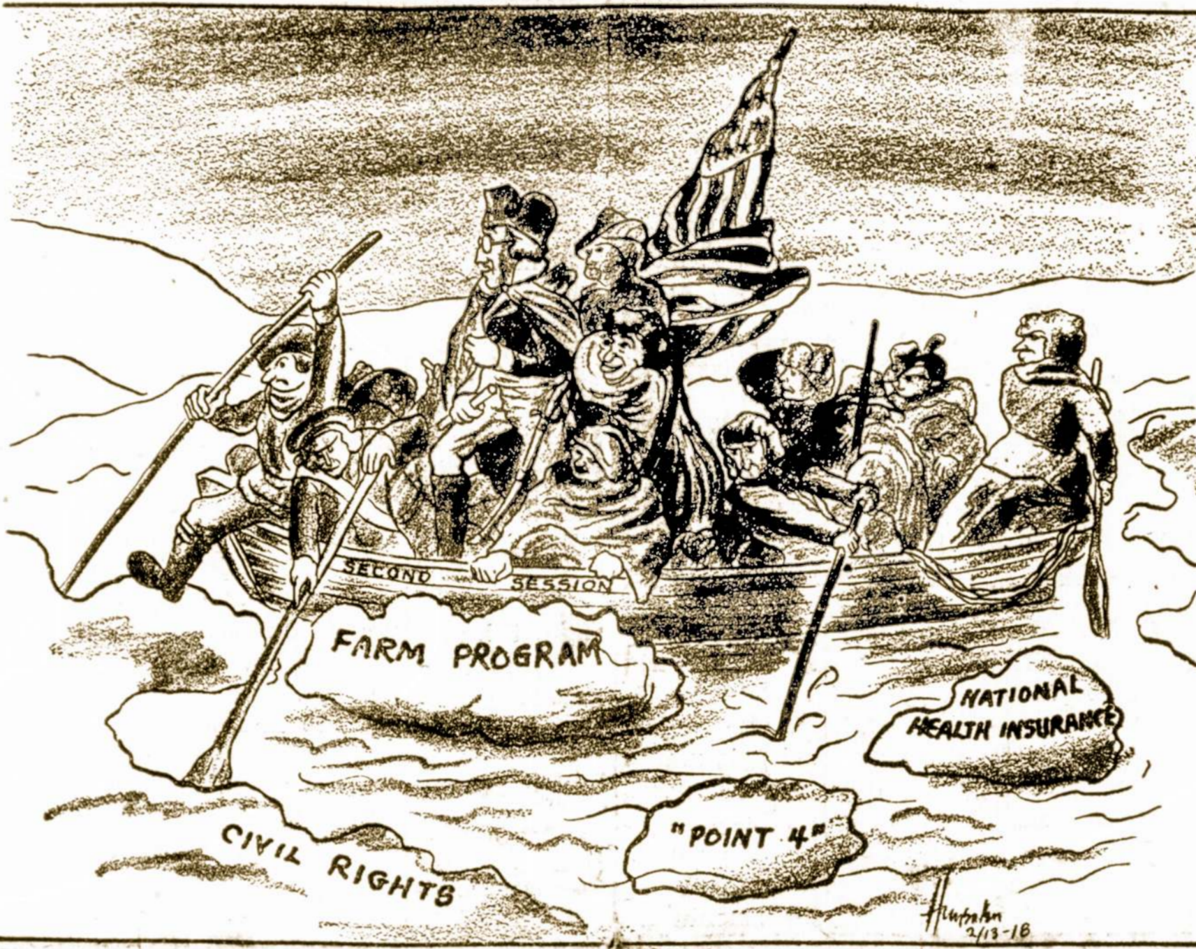
Disputed Passage, 1950

Kaip pasielgs prez. Trumanas, sunku pasakyti. Greičiausiai, jis paliks visą tą galvosūkį ramybėsje.