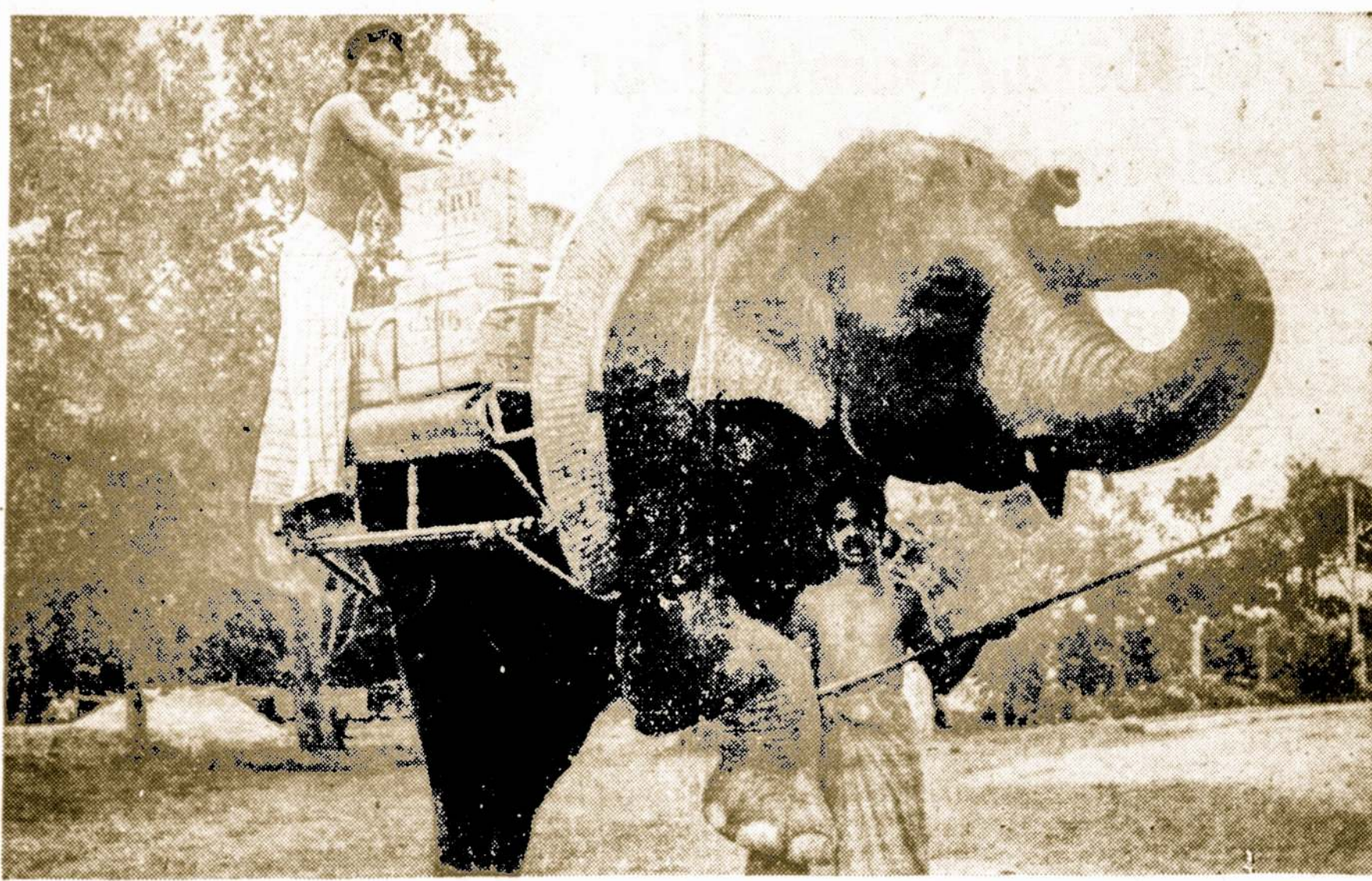
JUMBO DOESN'T FORGET—DO YOU? . . . A very light burden for a cooperative elephant is the hauling of C.A.R.E. latest delivery of many new scientific books to the University of Ceylon in Colombo. These books on every scientific subject represent the gifts of hundreds of Americans through their contributions to C.A.R.E.—U.N.E.S.C.O. book fund and local C.A.R.E. offices throughout the United States. Ceylon is only one of the total of 24 countries throughout Europe and Asia reached by C.A.R.E.

Už poros savaitių New Yorke įvyks Amerikos Lietuvių Tarybos metinis suvažiavimas. Reikalų apsvartyti bus daug, o poesdžiai teis pusantros dienos. Todėl reikia tikėtis, kad tarybos nariai, bediskusuodami įvairius klausimus, nepaspekės mažmožiuose, bet koncentruosis ant svarbesnių dalykų.