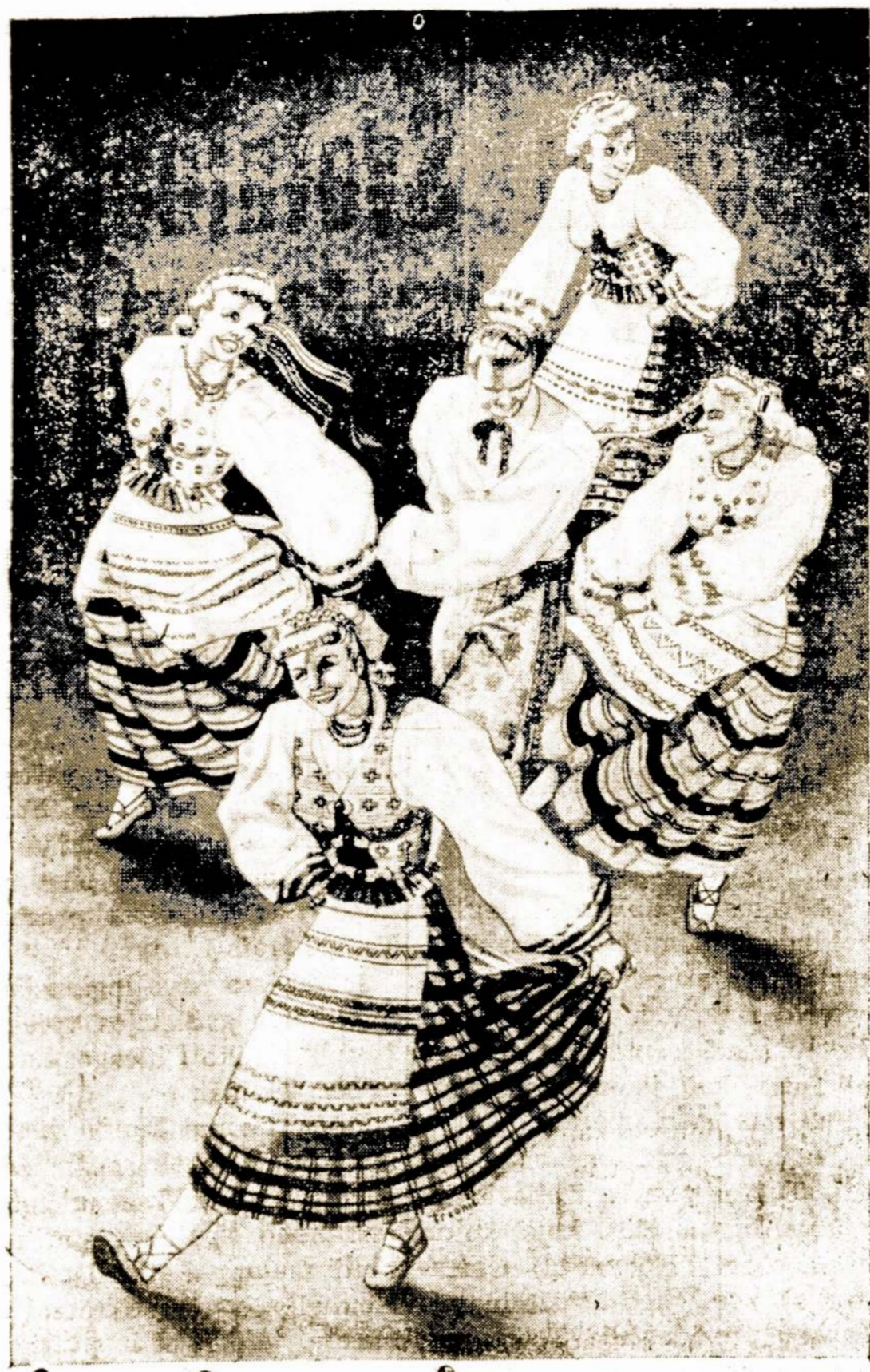
"ATEITIES" Sokėjų grupė, kuri dalyvaus Lietuvos Nepriklausomybės Minėjime Vasario 11 dieną Ashland Blvd. Auditorijoje.

Kokią dovaną siunčia man Naujieji Metai, ka likimas man lėmia? — švystelėjo jos mintyse.