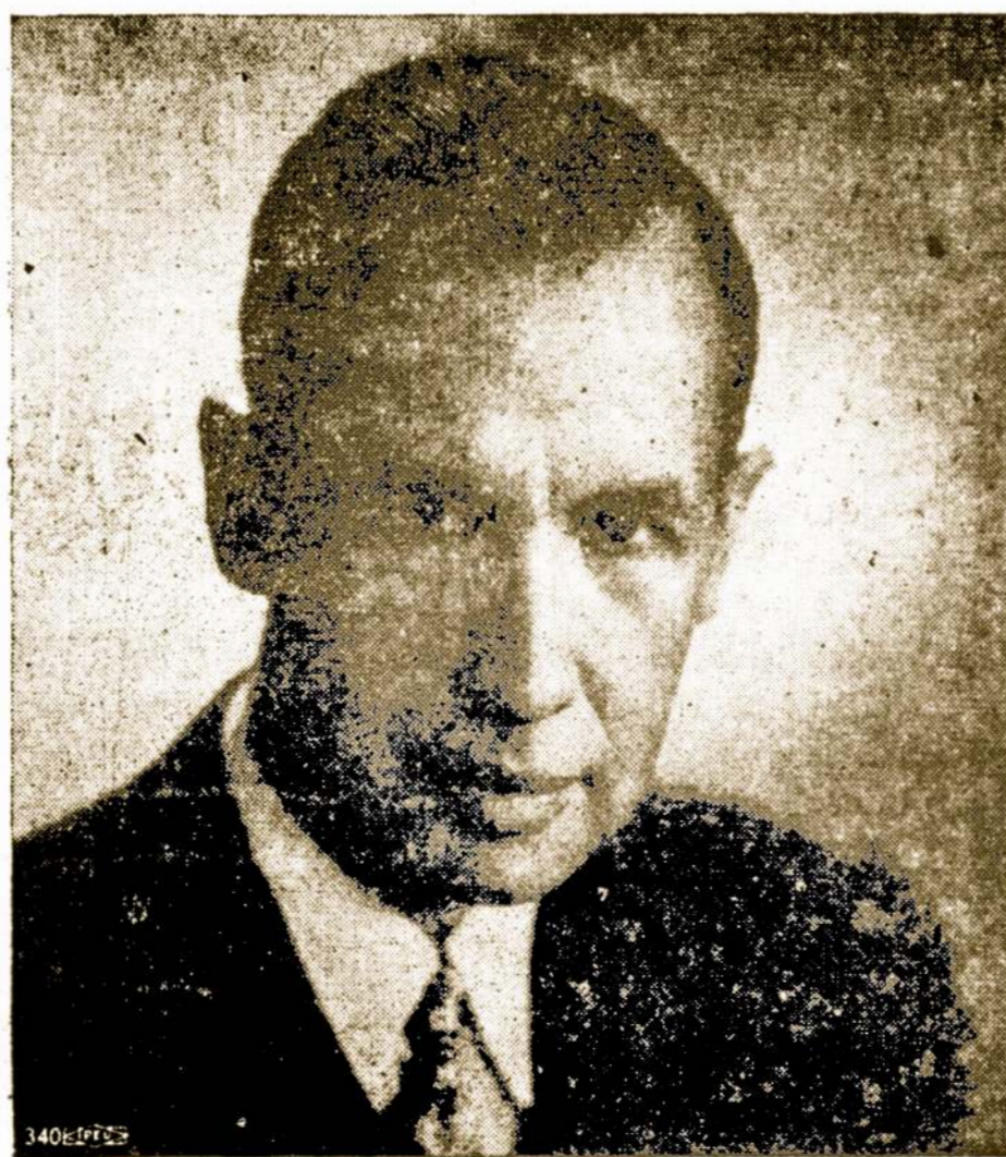
ADV. A. OLIS SANITARY DISTRICT KTRUST'SŲ PREZIDENTAS

Linksmų Velykų Švenčių Linkime Visiems Lietuviams.