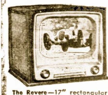
The Reverse—17" rectangular tube. Mahogany table model.

Parlor setai, kėdės, stalieliai, stalai, dinettes, dining room setai, kilimai, karpetai, lempos, miegamąjį kambario setai, so- fos, komodės, dreseriai, matra- sai, springai ir studio sofos.