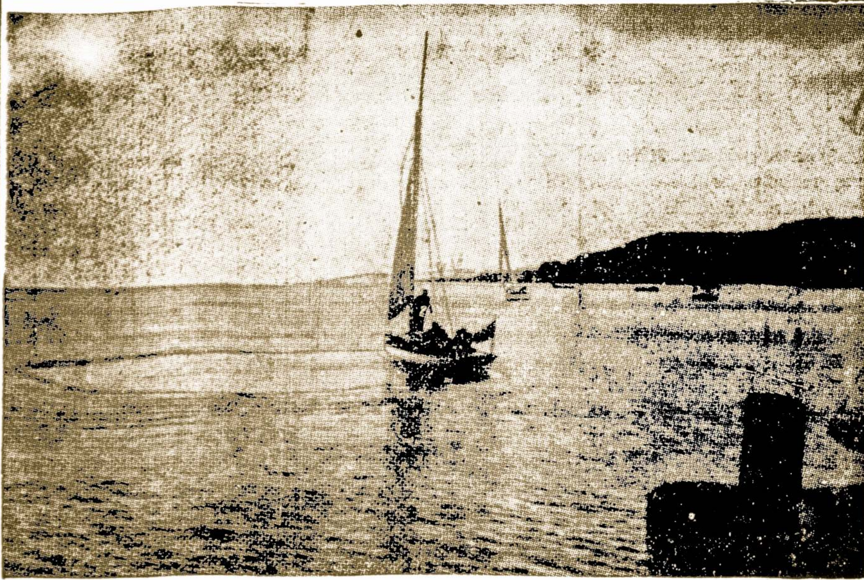
PALANGOS PAJŪRYS — VIENA LIETUVOS GROŽYBIŲ