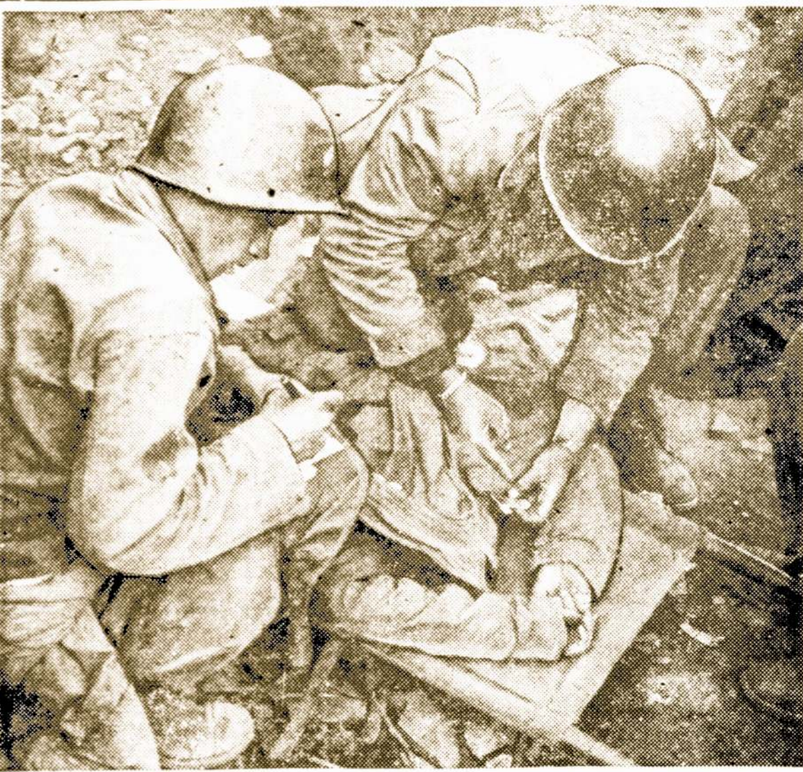
ZUVO KARIAUDAMAS PRIES KOMUNISTUS KOREJOJE

Medikališka pagalba atėjo per vėlai šiam Amerikos kareiviui. Du jo draugai prisega žuvusiam ženkleliu su parašu "Killed in Action".