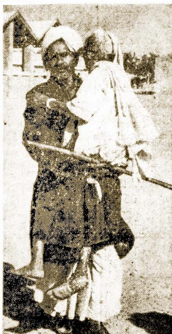
GOING TO VOTE... An old invalid woman unable to walk is carried to a polling booth at Gurgaon, India, in India's first national elections. Leftist forces dislodged some key Congress party figures in the voting in the new nation.