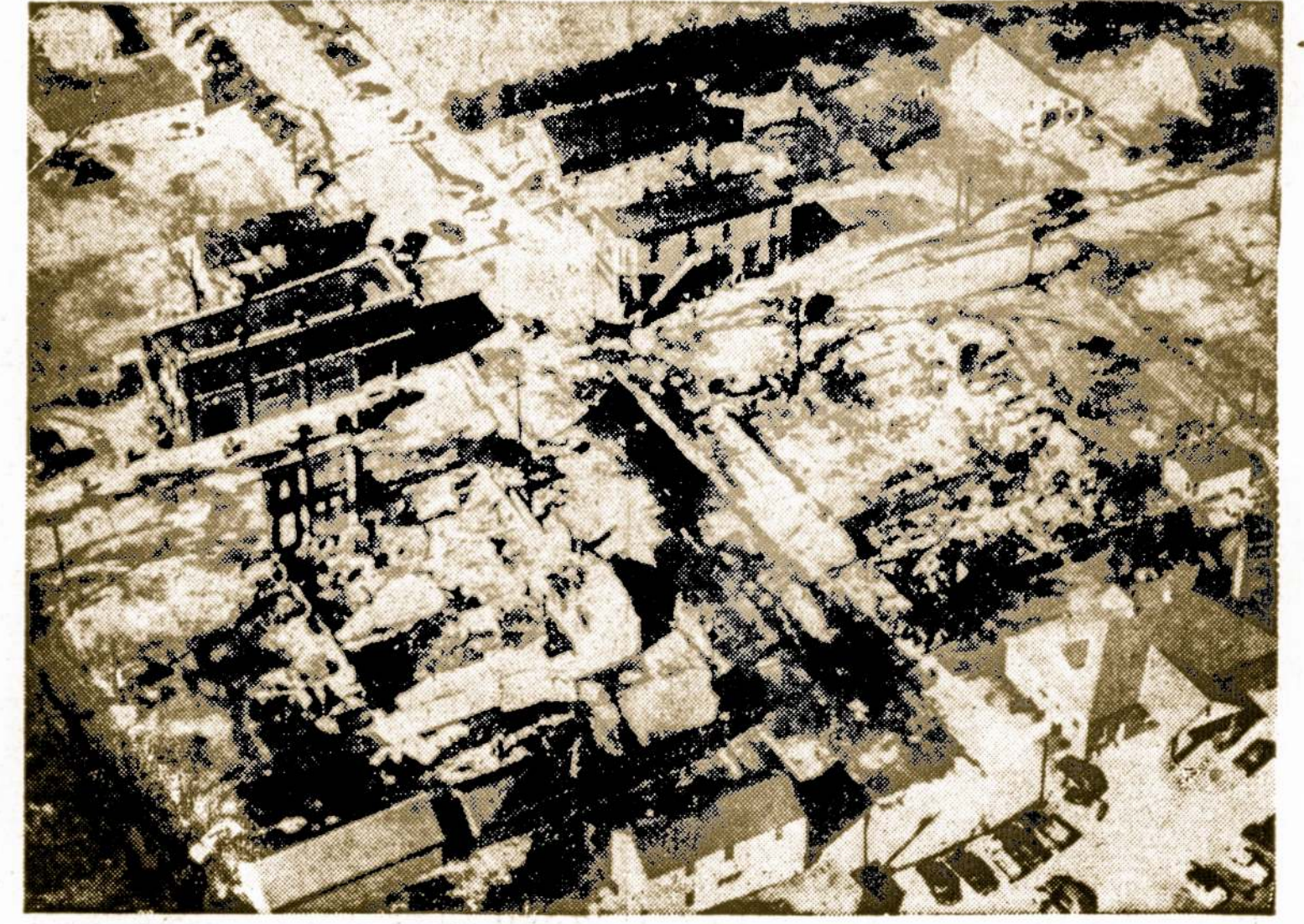
ELMA, IOWA. — Gaisras sunaikino visą miesto centrą, padarydamas nuostolių už pusę milijono dolerių. Tai buvo didžiausias gaisras to miesto istorijoje.

Galimas daiktas, jog ir Baltijos žuvelės jau nėra taip žiopolos, kad nesuprasti į kieno nagus jos gali pakliūti. Siaučiantis Baltijos pakrantėse teroras taip išgąsdino tos jūros žuvelės, kad ir jos pamačiusios maskolišką laivą bėga nuo jo kaip imandyamos.