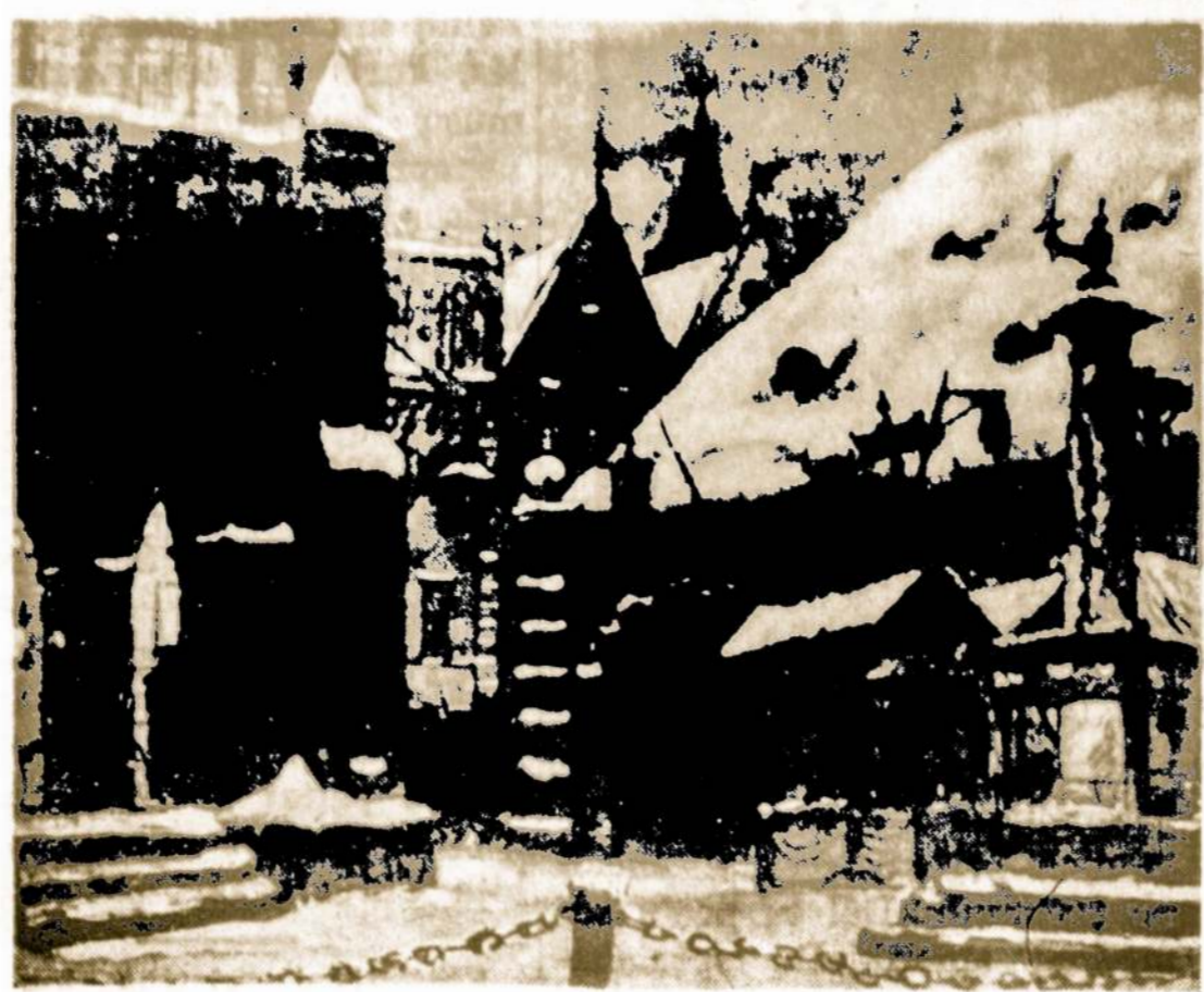
M. Dobužinskis Senas Vilnius žiemos metu

Kai lietuvių kaimynai valgio gaminimo dabojo sudėtinųjų dalių taupymo, tai Lietuvoje, priešingai, svaras sviesto, ar kvorta grietinės, desėtkas kiau-