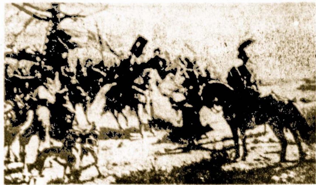
Vytautas Didysis Prisiekia Ginti Lietuvą

Su Vytautu Didžiuoju tamprius ryšius palaikė ir Krymo chanai. Girėjų dinastijos įsteigėjas, Krymą valdęs nuo 1427 metų, lygiai ir jo įpė-