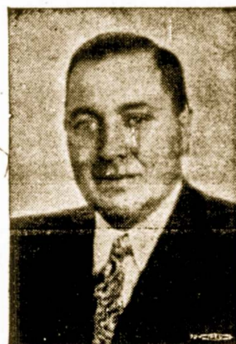
Richard J. Daley CHICAGO, ILLINOIS

LINKSMŲ KALĖDŲ ŠVENČIŲ IR LAIMINGŲ NAUJŲ METŲ VISIEMS MANO DRAUGAMS LIETUVIAMS.