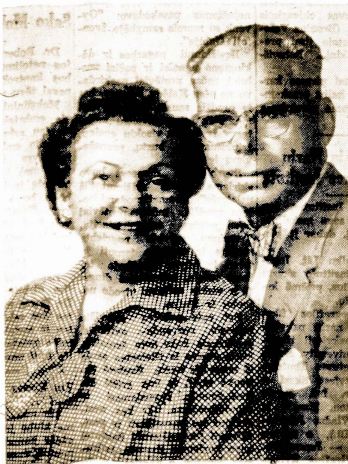
Ištolimos Afrikos linkime visiems mūsų draugams ir bičiuliams gražiai praleisti Kalėdų Šventes ir laimingai sutikti Naujuosius Metus.

Esame toli, kitoje pusėje Žemės, bet siela ir mintimis esame su Jumis.