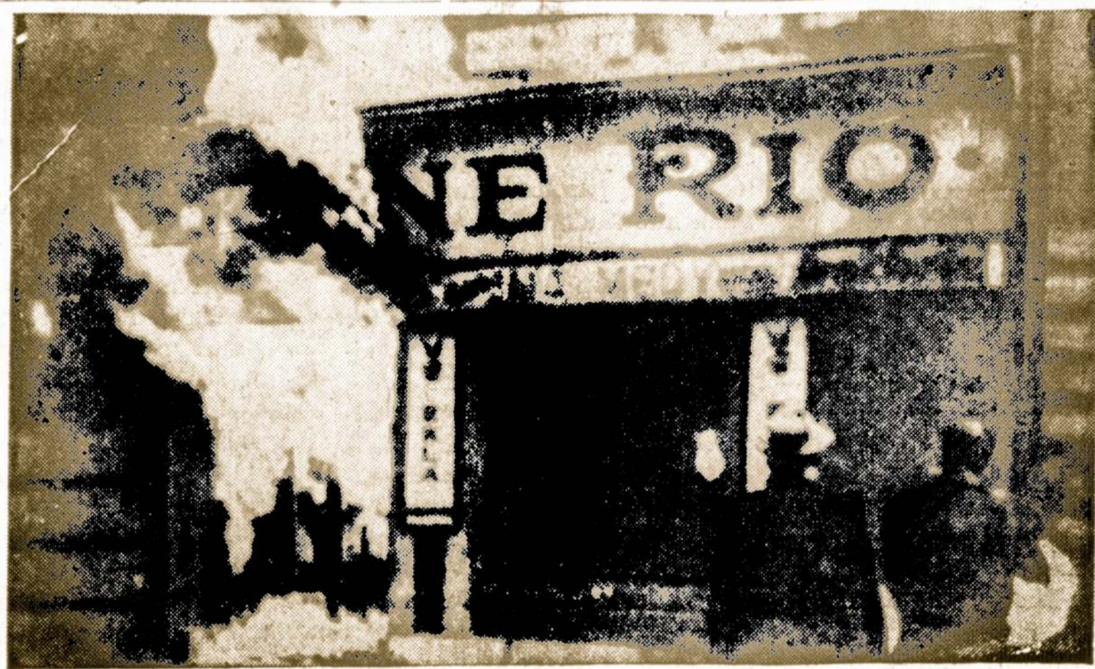
Liege mieste (Belgijoje) Cine Rio kino teatre įvyko eksplozija. Kiek žinoma, žuvo 39 asmenys (jų tarpe 22 vaikai). Sužeistųjų skaičius siekia 100.

Tuo būdu lenkai kato buvo, taip ir tebėra susikalde į kelias kovojančias tarpusavy grupes.