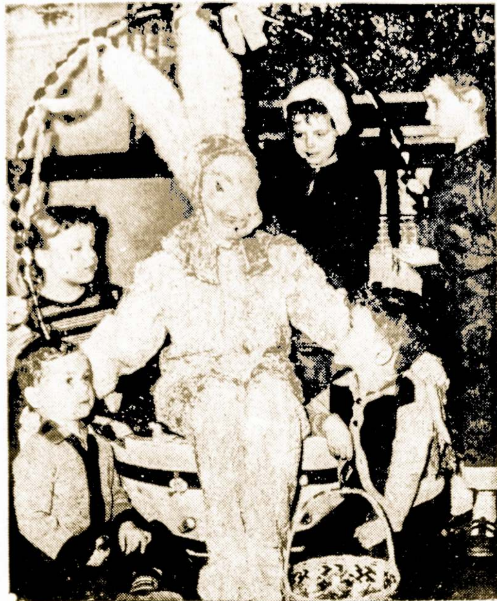
Dovanos Atidarant Naują Taupymo Šakaitą

Lankydamasis Ciceroje, atsitiktinai pasukau gatve, kur randasi Sv. Antano Taupymo-Skolinimo Bendrovė. Matau susisipietusią minią žmonių ir daugybę vaikų. Klausiu viena, klausiu kita, kas per dalykas, visi juokiasi ir į mane dėmesio nekreipia. Manau sau, užsukis pats pasižiūrėti, kodėl tie žmonės taip būriuojasi. Įėjus nustebau: pilna įstaiga žmonių ir tuojau mano dėmesį patraukė stovis didelis velykinis krepšis, kuriame sėdėjo didelis, gyvas zuikis!