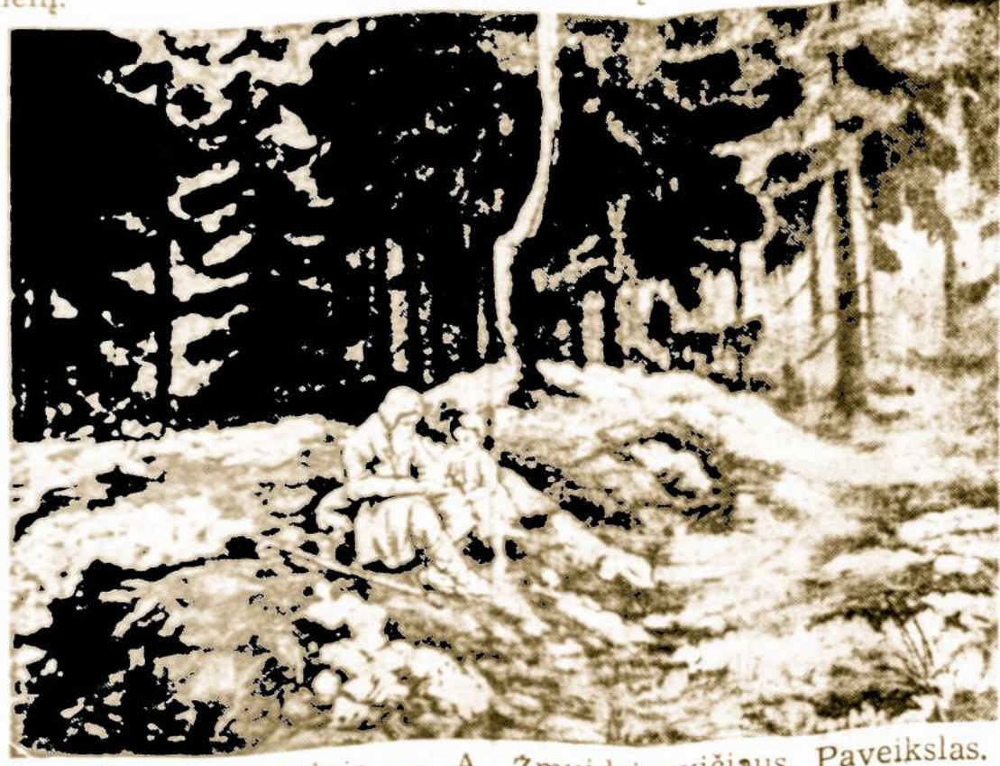
Prie Piliakalnio — A. Zmuidzinavičiaus Paveikslas.

Bet Rambyno šlovė visgi nebuvo išnykusi. Padavimai apie jį buvo gyvi žmonėse. Užsilikę lietuviai pasakojo savo vaikams apie seną šventovę; apie amžiną ugnį; apie aukurą, kurį išdraskė kryžiuočiai; apie krivai slaptai prasmuko pro kryžiuočių sargybas ir įsteigė naują Romovę Sventaragio slėnyje.