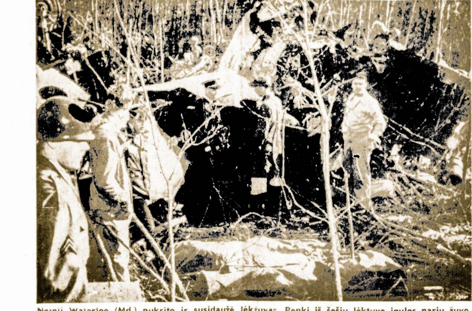
Neroti Waterloo (Md.) nukrito ir susidaužė lėktuvas. Penki iš šių lėktuvo įgulos narių žuvo. Gyvas išliko tik vienas.

Be to, nėra to bloko, kas neišėit i oerą. Gėnevės konferencijos žlugimas atidarys akis tiems, kurie, kaip Chamberlain ir Deladier, tikėjo i galimybę susitarti su diktatoriais ir išvysdinti "co-existence" principa. Tie patys prancūzai ir anglai, kurie per pastaruosius dešėtika metu patalkavo Kremliui ir aplinkiniams keltais būriuos paaukole jiems Baltijos kraštus, dabar gal aiškiau supras savo kvailumą ir išsižiama.