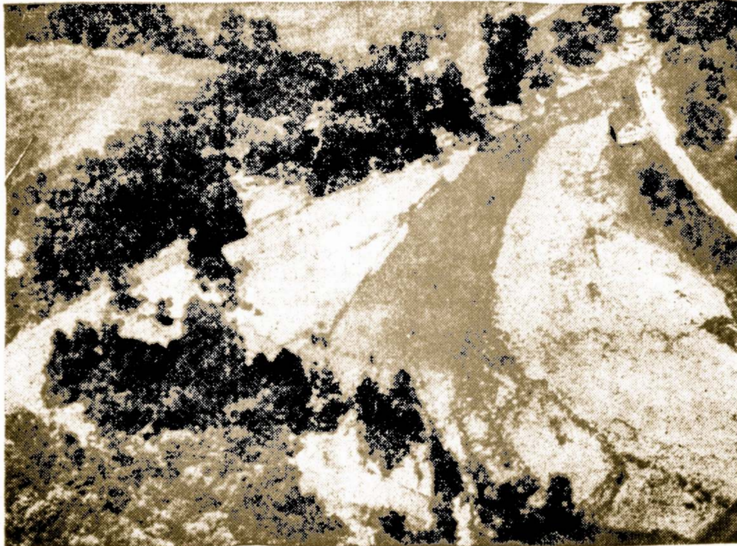
Vairde matomos menkos liekanos iš Camp David, netoli Stroudsburg, Pa., kur buvo patvinusi Broach Creek. Bent 27 iš stovyklos mirė, 10 pradingo ir 9 išliko. 9 valstybių srity potvyni žuvo bent 165 žmonės, o nuostolių pridaryta neapskaičiuojamai.

Sodybos ir miestai pradėjo iškurti tais laikais, kuomet žmonės paliovė klastoti ir omė pastoviai apsigyventi pasirinktose vietovėse.