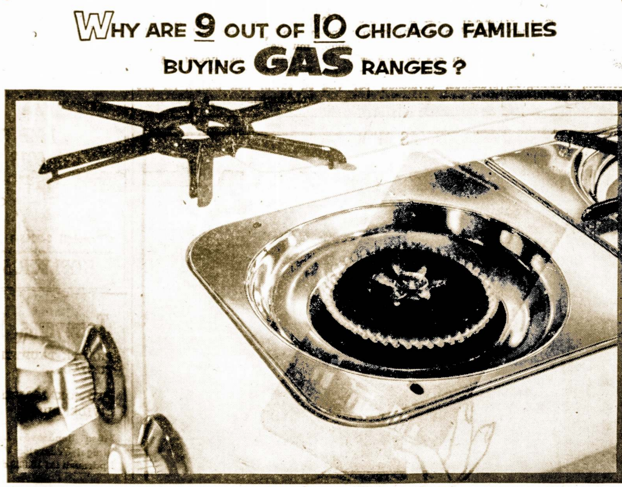
Modern GAS ranges have a burner within a burner for precision cooking. The small center simmer burner operates in conjunction with the main burner to give you any degree of heat you want—fast!