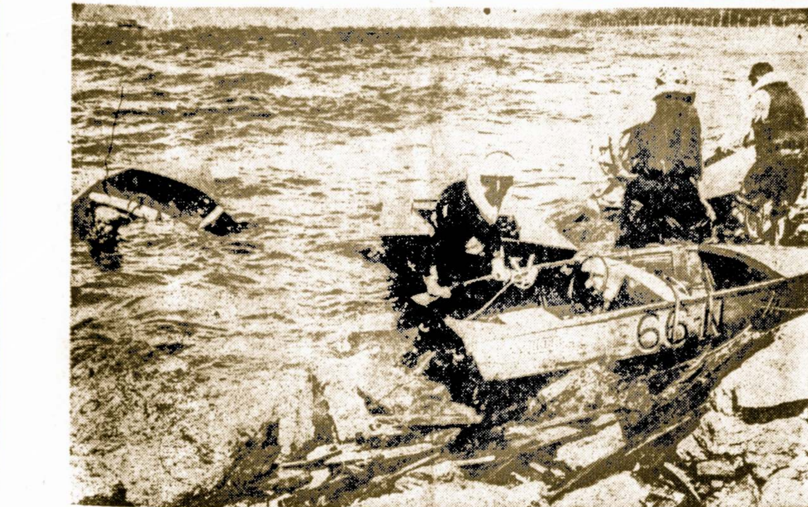
Trys motorlaivių vairuotojai metinėse Manhattan rungtynėse stipraus šiaurinio vėjo su laiveliu buvo užnešti ant uolų.

Taigi, Australijos premjero Roberto G. Menzies atvykimas į Washingtoną nėra vien tik informacinio pobūdžio. Menzies išdėty mūsų vyriausybei visa padėties rimtuma ir prašys jos artimiaus kooperuoti su anclų ir prancūzų užsimojimais užtikrinti laisvą plaukiojimą Suez kanala.