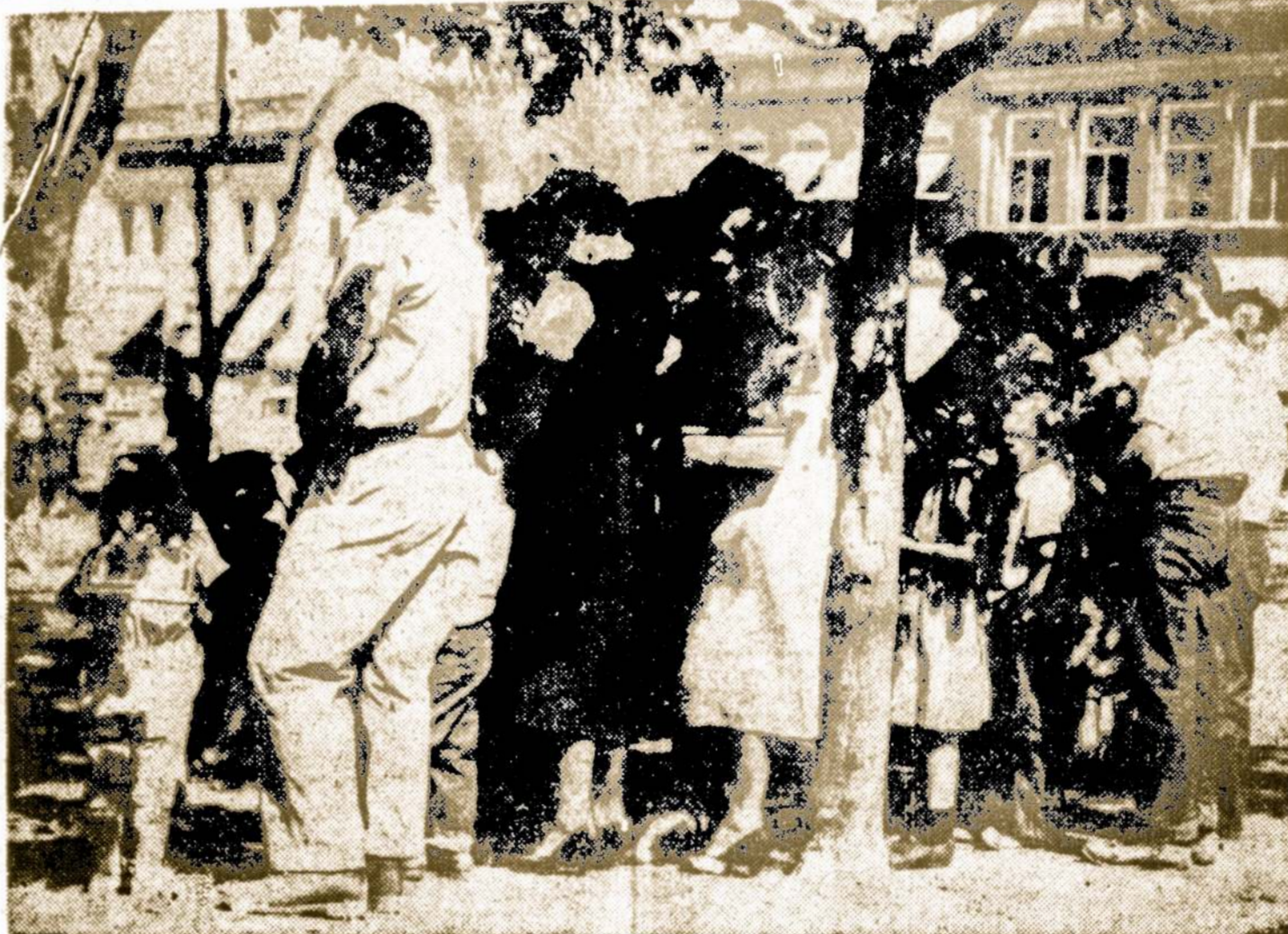
Holton, Kansas, vienu metu buvo uždarytos krautuvės ir gyventojai susirinkę miesto aikštėje meldė Dievą lietaus. Daugelyje vietų dėl sausrų suvėluojama žiemkenčių javų sėja.

Kiekvieno suplakimu širdis stūnčia ir arterijas 3 ar 6 kraujo uncijas.