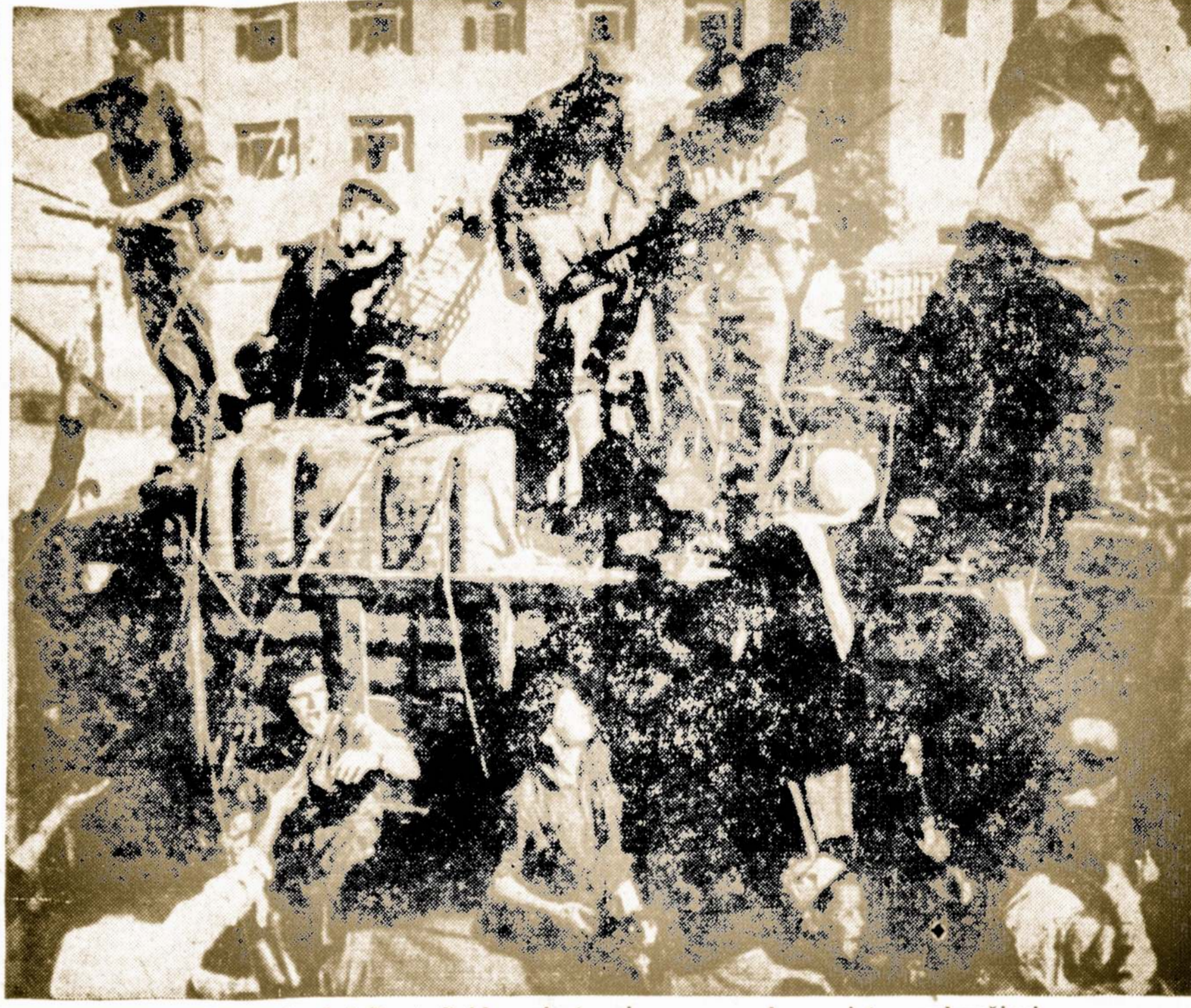
Britų kariai Port Saido mieste gina nuo arabų maisto sunkvežimį.