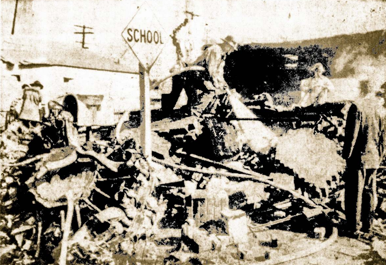
Netoli El Toro laivyno bazės nukrito ir atsimušė į knygu ryšyklą AD-5 Skyriver lėktuvas, už- mušdamas du tos ryšyklos darbininkus.

Mums ir šiandien reikalinga daugiau pionieriškos dvasios, daugiau drąsos ir pasitikėjimo savimi. Turima smarkiau pa- esifundinti organizavimą, biz- nio, kultūros ir kultūros veit- vi. Mes turime daug patal- tik reikta tas sunaudoti gra- žiam kūrybiniam darbui.