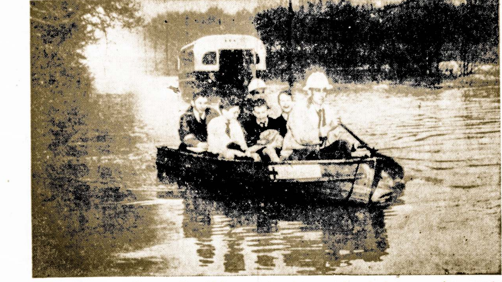
South Chattanooga, Tenn. — 30 mokinių yra nuimami nuo autobuso, kuris buvo vandens apsemtas

Tačiau, pasak to korespondento, ir iš to gali išeiti kas nors gero.