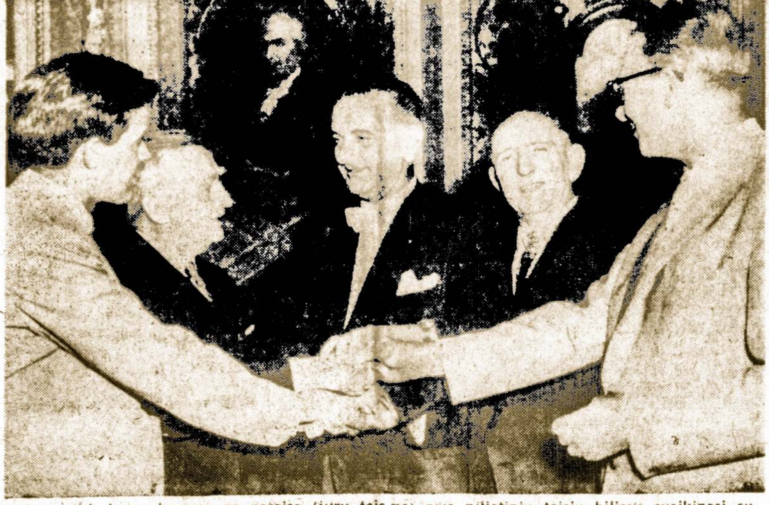
Senatoriai, kurie baisavo uz paraisa (jury teis na) prie pilietiniu teisiu biliaus sveikinasi su prezidentu Eisenhower. Tie senatoriai (iš kairės) yra: Frank Church, Joseph O'Mahoney, Lyndon Johnson, Richard B. Russell ir Estes Kefauver.

Dar atkreipę lenkų dėmesį sekmdieninis judėjimas Vilniaus parduotuvėse, muziejuose ir parodose. "Deja, restoranuose aptarnaujama labai šaltai. Sausakimiai autobusai. Panašiai yra ir Varšuvoje... Vilnius turi daug žalumvnu, parku, puikias gatves, bet už tai maža restoranu ir valgykliu. Tokie rūošėliai ir mums, Varšuvos gyventojams, supranta ml."