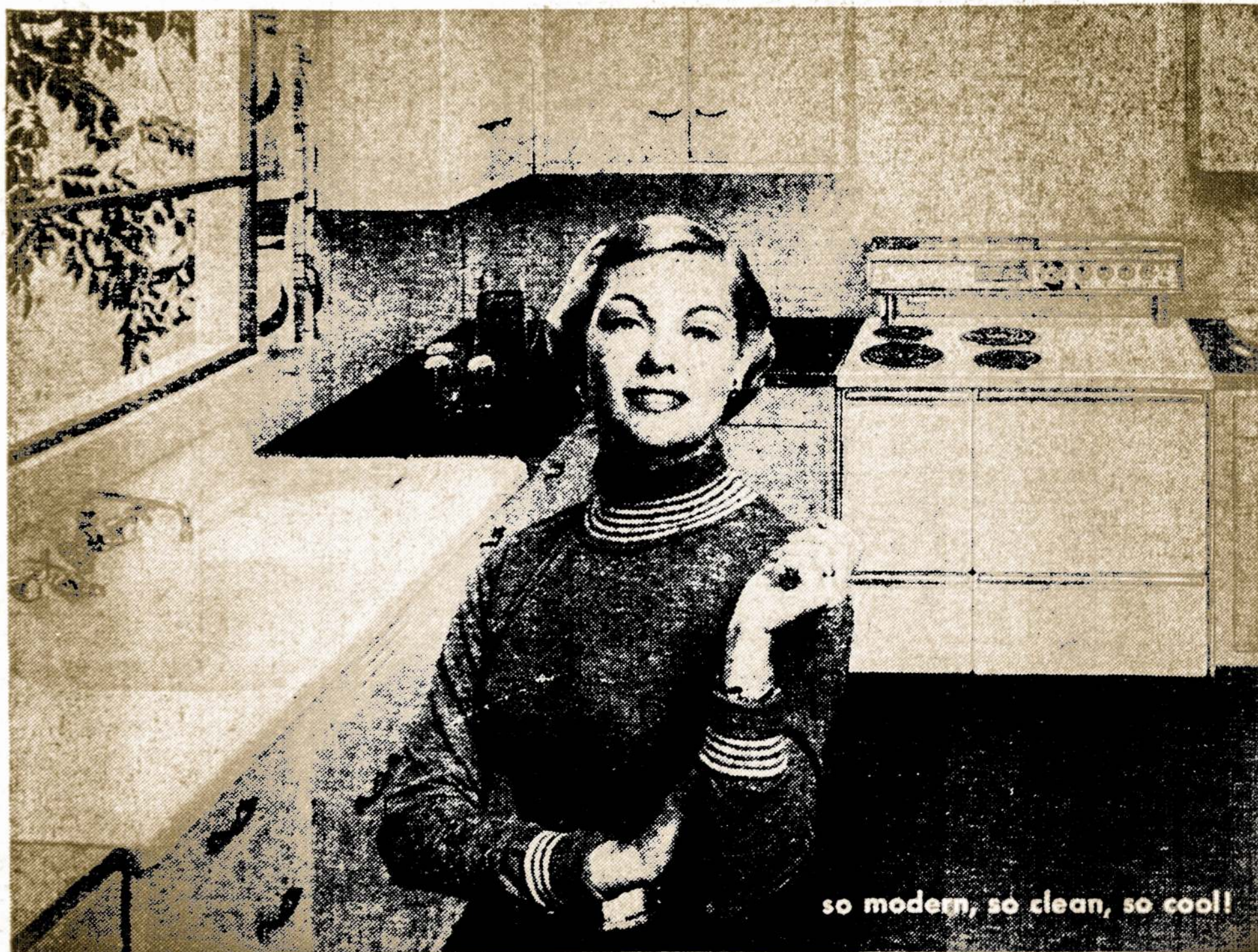
so modern, so clean, so cool!

nothing gives your kitchen the modern look like a modern electric range and nothing cooks cleaner, cooks cooler, or cooks food faster!