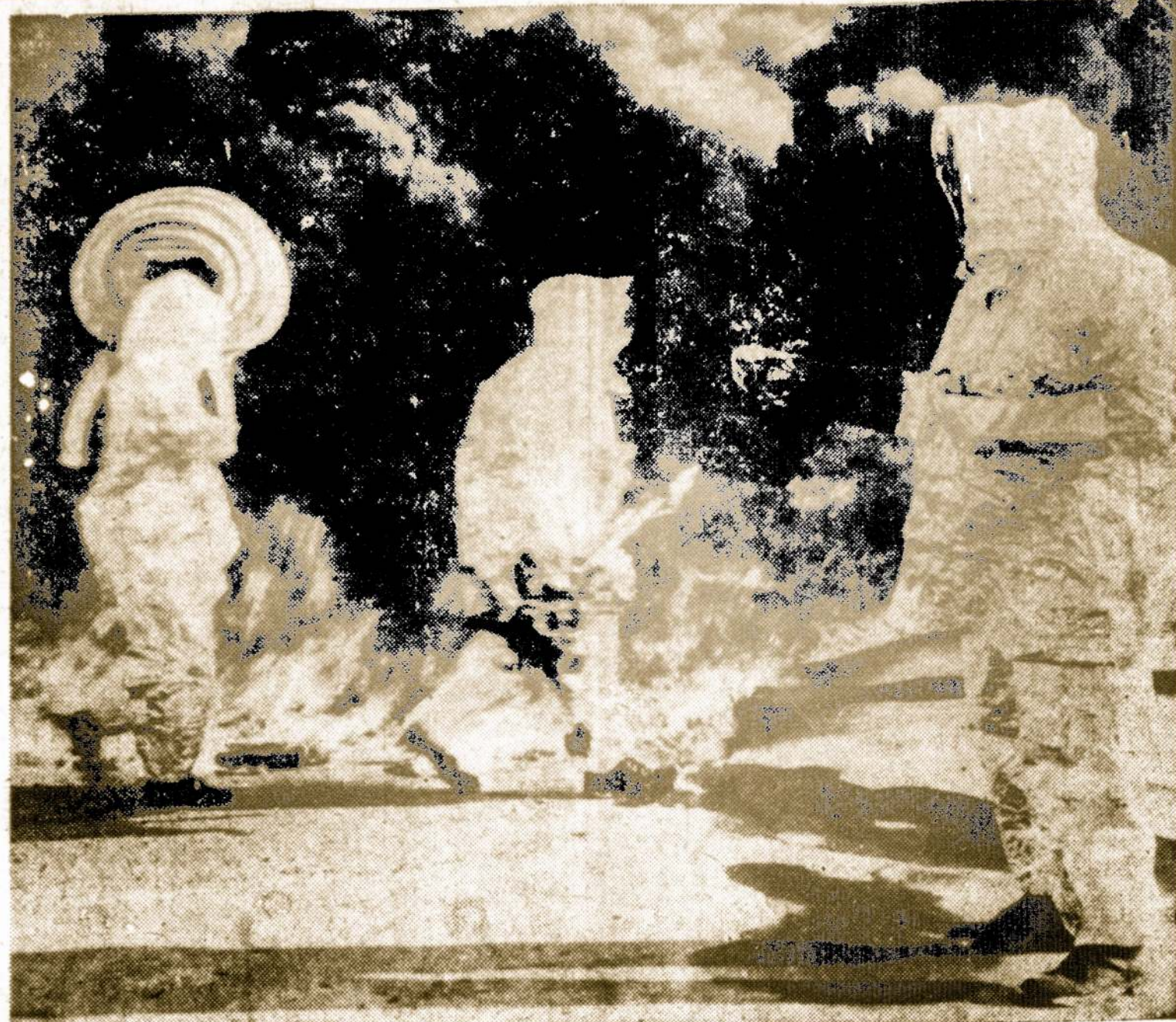
Armijos personalas demonstruoja naują aliuminuoia apvaiką, pagaminta gaisrininkams iš nedegamos medžiagos. Apvaikais turi galvai gaubtuvą, veidui kaukę, kojines, pirštines ir rankoves, visa padaryta iš aliuminijų atsaugo nedegamo popieriaus.

Į tokią pasiūlymą pasikeisti "parlamentarais" mūsų valsty- bės departamentas neatkreipė jokio dėmesio. Gerai ir padarė.