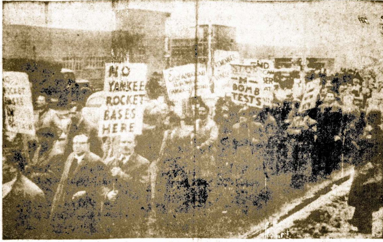
Londono ke. Unistai maršuoja apink Ruislip av. a. o. s. eazę netoli Londono, protestuodami prieš leidimą amerikiečiams įsteigti raketų bazes Brita.ijoje.

Be nei viena, nei kita pusė nepasiūlo nieko konkretaus su mažinimui bedarbės.