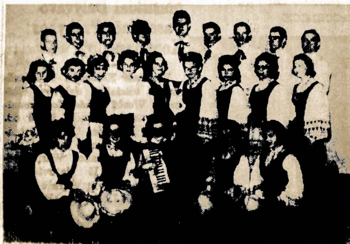
Grupė Jūrių Skautų ir Skaučių Šokėjų, Kurie Atliks Tautinius Sokius Sandaros Bankiečio Programoje.

Niekas nėra tiek vertas, kad būtų mylimas. Bet niekas nėra tiek nusikraustas, jog negalėtų tikėtis meilės.