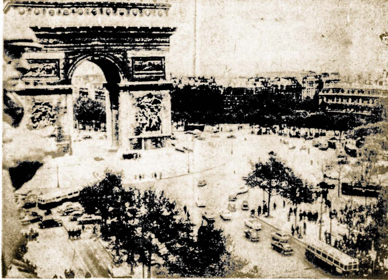
Salmis apsimovė policininkai laiko užtvėre Champs Elysees prie Triūmo Arkos Paryžiuje, kur vis dar prisibijoma demonstracijų dėl krizės Alžyryje.

Pranašaujama, jog per gegužės mėn. ekonominė padėtis turės pagerėti, nes, numatomas įvairiose pramonės srityse gamybos atnaujinimas. Blogą ženklą teikia tik automobilių pramonė, nusprendusi liepos mėn. nutraukti 1958 metų modelių gamybą ir ją atnaujinti ne anksčiau, kaip rugsėjo mėnesį. Tai, aišku, ne vien laikinai padidins bedarbių skaičių, bet turės kiek atsiliepti ir į kitas pramonės šakas.