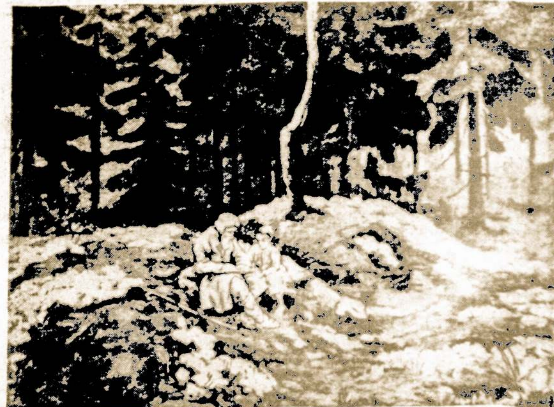
Senelio pasakos apie praeities įvykius

Tai Plačiai Apimantis ir Įdomus Skaityti Veikalas